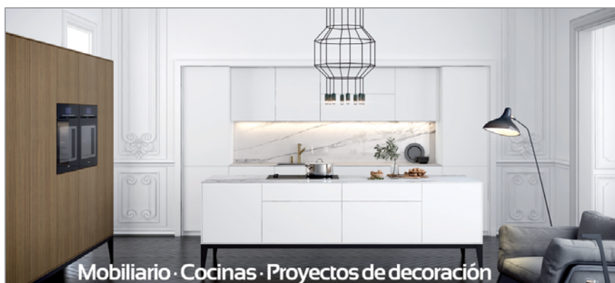
Mobiliario · Cocinas · Proyectos de decoración

Cuentan con profesores con la máxima cualificación, amplitud de turnos y niveles (siempre que se completen con un mínimo de 12 alumnos); se imparten conforme al modelo curricular propuesto por el Consejo de Europa; y ofrecen diferentes niveles según conocimientos previos. Están destinados a personas en edad laboral.