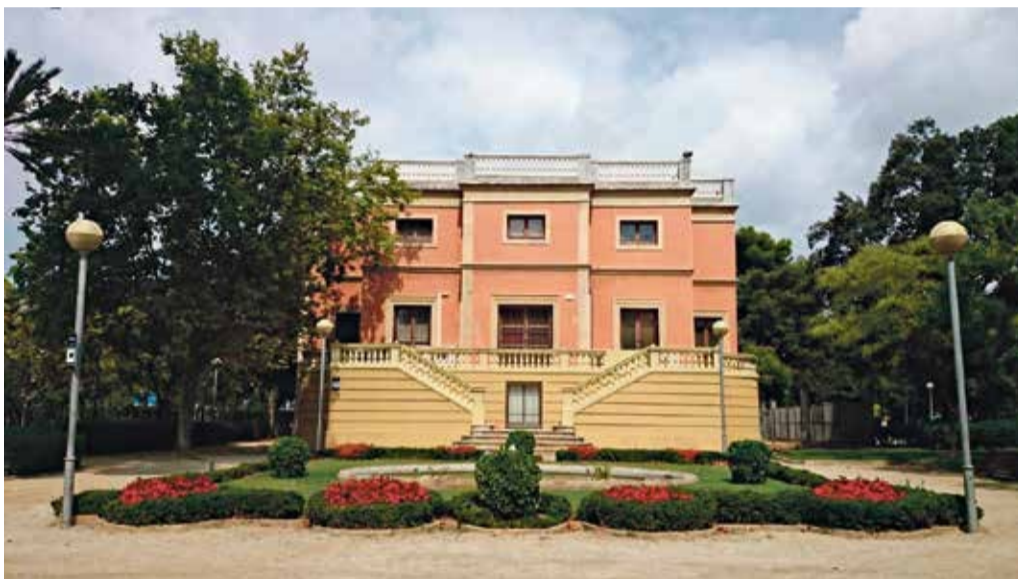
La EOI de Esplugues se encuentra en el corazón del Parc Can Vidalet

que los ordinarios-, el ruso también es una de las novedades. El EOI de Cornellà llevó a cabo entre junio y julio una serie de encuestas entre las personas que conforman su base de datos. El objetivo era conocer sus intereses idiomáticos y el ruso fue la gran petición popular. Es por este