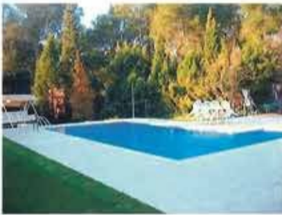
Lote 14 Vivienda Unifamiliar en Sant Cugat del Vallès