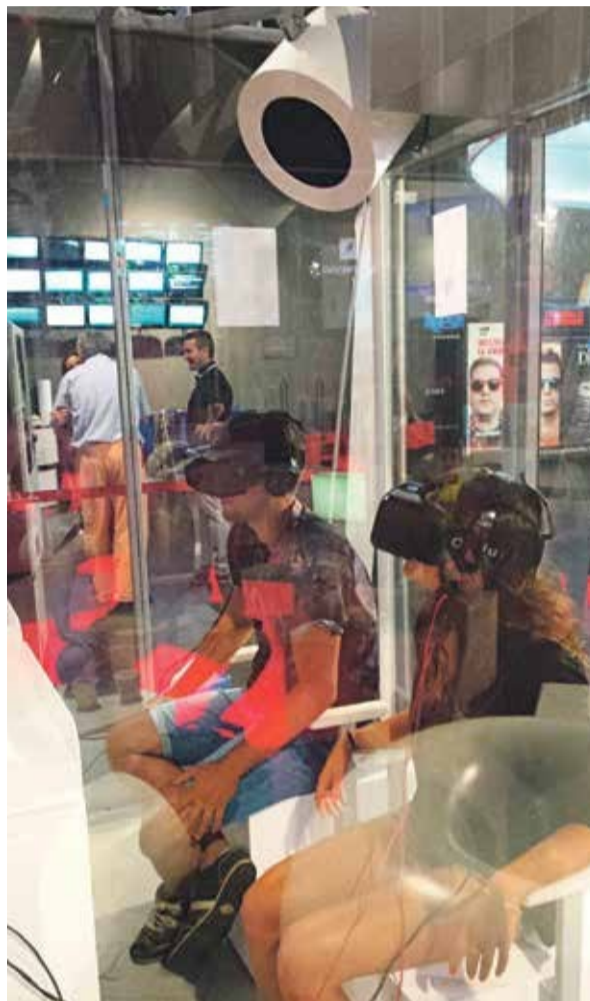
La Warner colocó una cabina de realidad virtual para el preestreno de 'En el Ojo de la Tormenta'

Efectivamente, un equipo técnico de la distribuidora Warner aterrizó en El Prat, procedentes de los Estados Unidos, para llevar a cabo el montaje de esta simuladora que contaba con todos los ingredientes para transportarnos al 'ojo del huracán': cabinas con efectos de ventilación, mecanismos de vibración, explosión de aire, Webcams, además, de un casco de realidad virtual, también para personas con movilidad reducida, completan todo lo necesario para vivir una auténtica aventura en el mismo hall de los cines de Splau. Pero para que esto sea necesario, es necesario un trabajo previo excelente para que