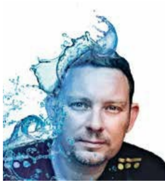
Albert Adrià L'Hospitalet Chef reconocido con dos Estrellas Michelin

Personajes que han conseguido, por su labor profesional y del ámbito que sea, una repentina notoriedad social