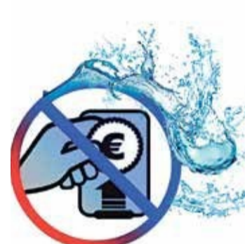
STOP Pujades Baix Llobregat

De tanto en tanto, la calma del río y de sus cuencas se ve sorprendida por las inesperadas inundaciones que obligan a la movilización ciudadana