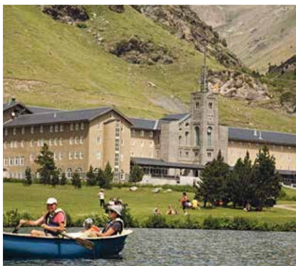
El llac de Núria acull diferents activitats esportives

Per a participar només cal inscriure's a www.valldenuria.cat i recollir el braçolet amb el xip per a fitxar a la sortida i als 4 punts de control del camí.