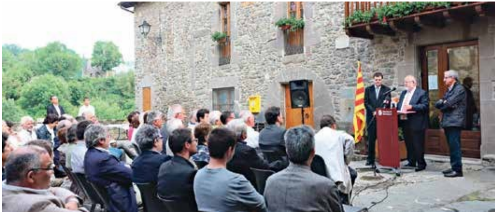
El nou Programa de suport a les inversions locals, presentat a Rupit i Pruit, està dotat amb 50 MEUR

immersos els municipis. El programa de suport a les inversions locals, dotat amb 50 MEUR, es va aprovar a la Junta de Govern de la Diputació de Barcelona i en el repartiment de recursos s'ha considerat especialment un factor de millora per a aquells municipis amb població inferior als