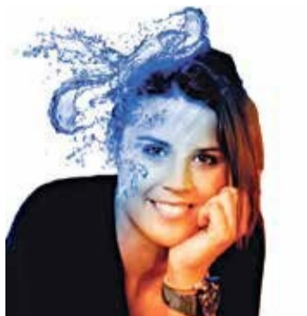
Laia Sanz Corbera Piloto de Trial

|| La de Corbera ha pasado ya a ser de las mejores deportistas españolas al ganar el Dakar por tercera vez consecutiva.