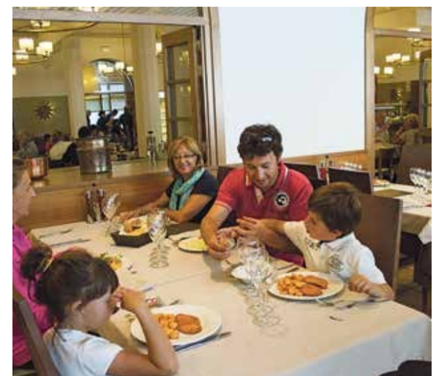
La gastronomia guanya cada cop més protagonisme