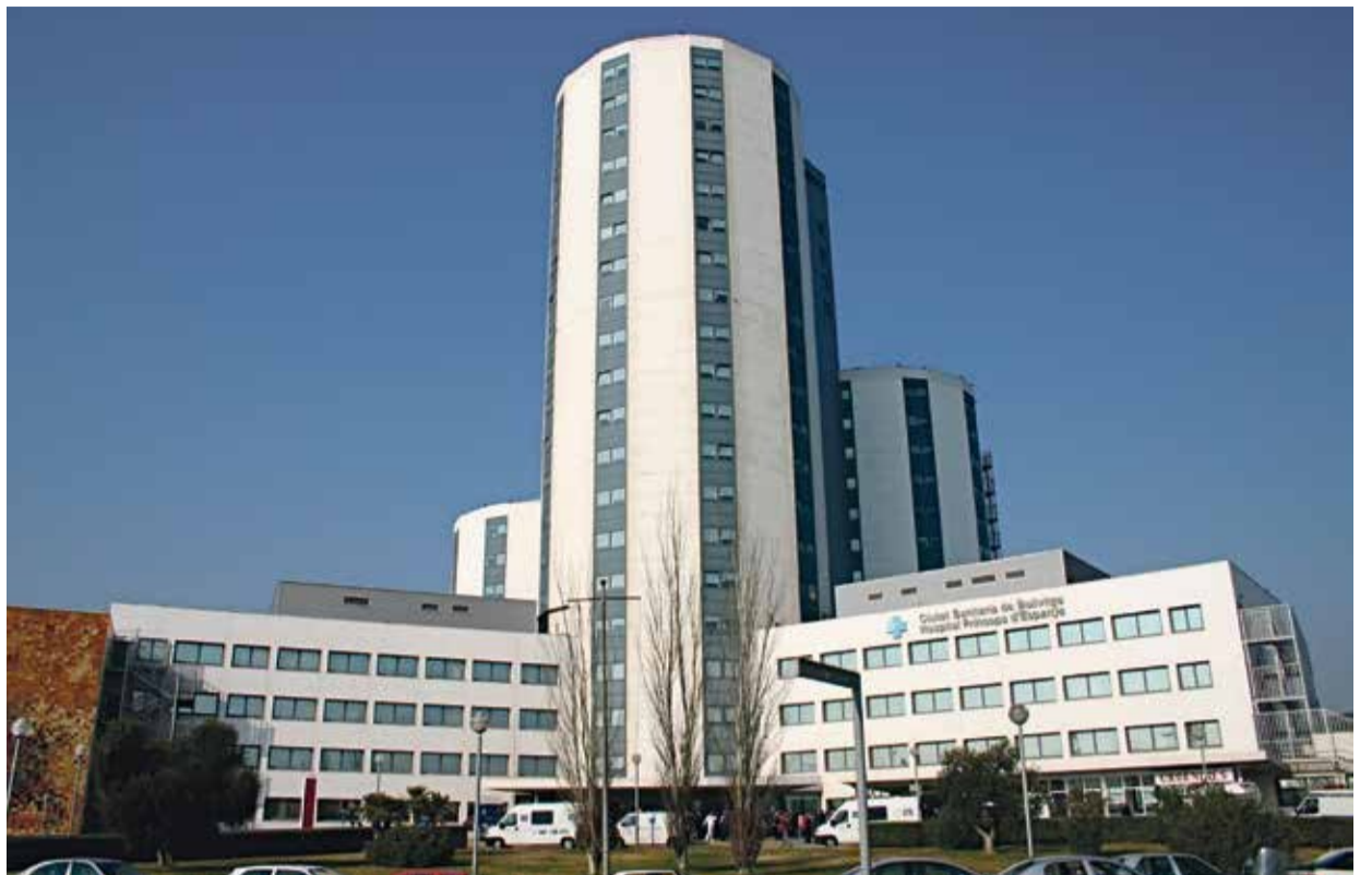
Los expertos recomiendan la hospitalización a domicilio para mejorar la calidad de vida de los pacientes crónicos. En la imagen, el Hospital Universitario de Bellvitge, centro de referencia sanitaria

Dios nos da la vida: defenderla y denunciar todos los ataques que ella recibe es una voz profética que el mundo y nuestras conciencias necesitan. ¿Quién hoy nos proclama dónde está la verdad del ser humano, de su dignidad a vivir con justicia? ¿Quién nos propone una vida que colma y completa nuestra existencia? ¿Quién nos muestra el camino de paz, de reconciliación y de esperanza que realza la belleza de la vida? Alguien tendrá que denunciar todas las mentiras y sus consecuencias, que ensucian y dañan el derecho fundamental de todo ser humano a la vida, más allá de su credo, clase social, raza o cultura. ¡Ojalá! hubieran muchas voces que, sin complejos ni relativismos, alzarán la voz para desenmascarar a los mentirosos.