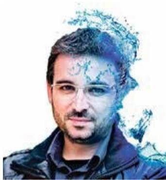
Jordi Évole Cornellà Periodista, presentador y director de Salvados

El Llobregat valora la transparencia en la información con este premio periodístico a una pluma de entre las siguientes de la comarca