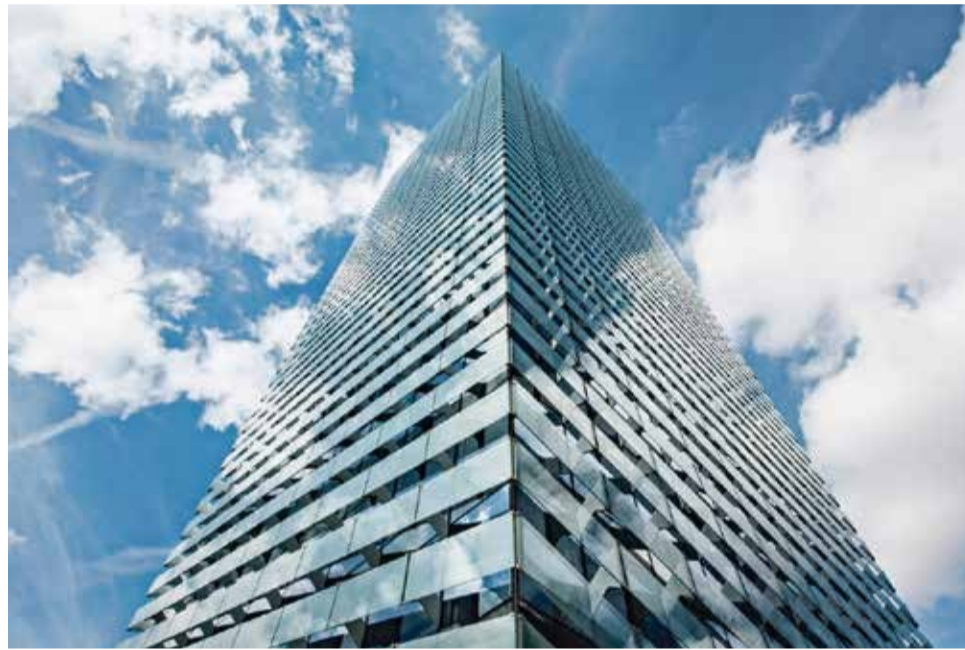
El gigante Puig, con sede en L'Hospitalet, cobrará de Equivalenza lo acordado tras el fallo de la Audiencia Provincial de Alicante: 100.000 euros

En este sentido, reclamaban un aumento de esta cifra al "haber comprobado que los actos de infracción han persistido después de esa fecha". La Audiencia Provincial entiende, en cambio, que ni