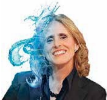
Mercedes Milà Esplugues Periodista y presentadora de Diario De

|| Más allá de la audiencia, el programa 'Diario De' ha denunciado muchas de las injusticias que se dan en el día a día.