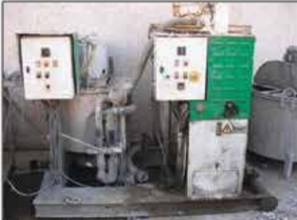
Lote 25 Planta de Inyeccion IPC Mod. GIET4