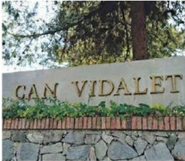
La EOI de Esplugues fue creada en 1999