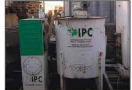
Lote 24 Planta de Inyeccion IPC Mod. GIET8