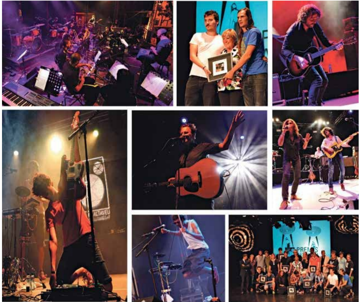
El Altaveu rompe fronteras y disfruta de la programación más internacional