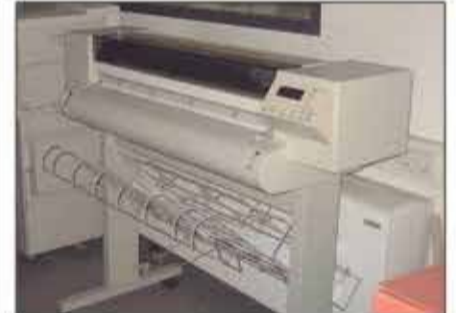
Lote 107 Plotter HP