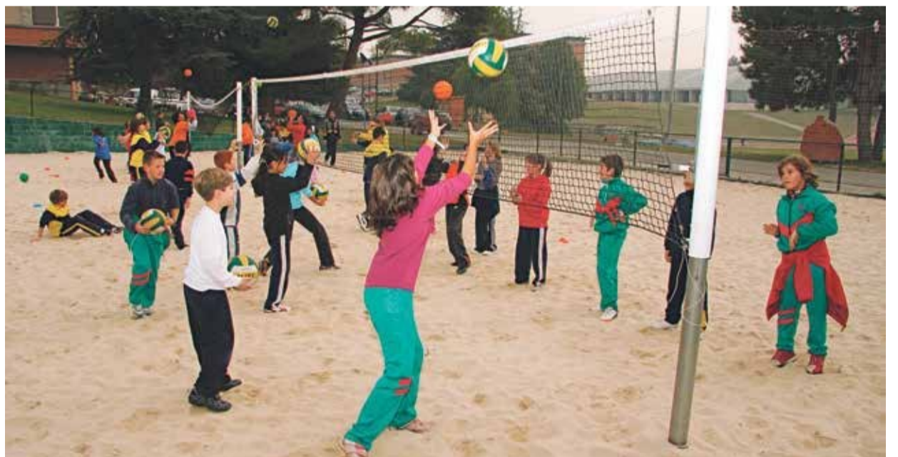
Activitat d'esport escolar

La Secretaria General de l'Esport i la UCEC mostren a través d'aquest protocol la voluntat de continuar treballant conjuntament en la implementació del Pla Estratègic d'Esport Escolar de Catalunya i en el desenvolupament dels programes d'Esport Escolar de la Generalitat, instruments que s'han de preservar per seguir millorant el servei envers els nostres infants, adolescents i joves, i per establir els fonaments per a l'esport en edat escolar dels propers anys.