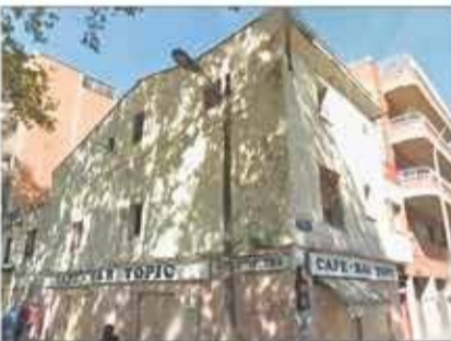
Lote 110 Edificio de viviendas en venta en Badalona