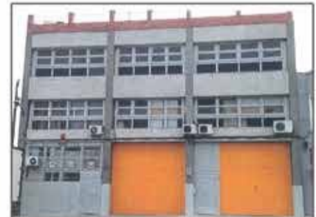
Lote 101 Nave en alquiler (3.715 M2), en Sant Boi de Llobregat

Todos estos lotes y más, que puede consultar en la página web, proceden de liquidaciones y subastas. Todos tienen precios excepcionales, de ocasión.