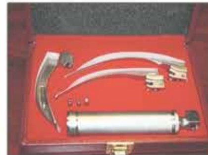
Lote 78 Laringoscopio con palas de acero