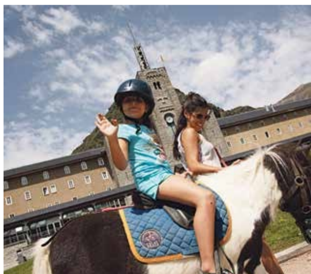
Les opcions de la Vall de Núria no tenen edats