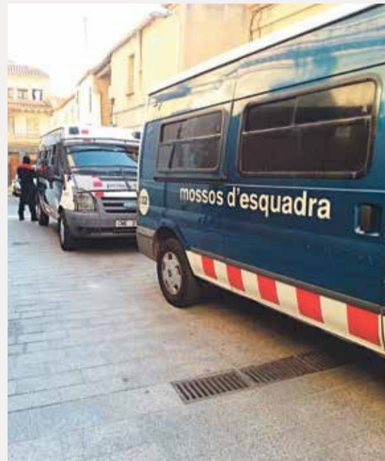
La Región Metropolitana Sur cuenta con 1.183 efectivos en todo el Baix Llobregat y l'Hospitalet

|| La RPMS tiene presencia en cuatro comarcas: Baix, Garraf, Alt Penedès y la ciudad de l'Hospitalet (Barcelonés).