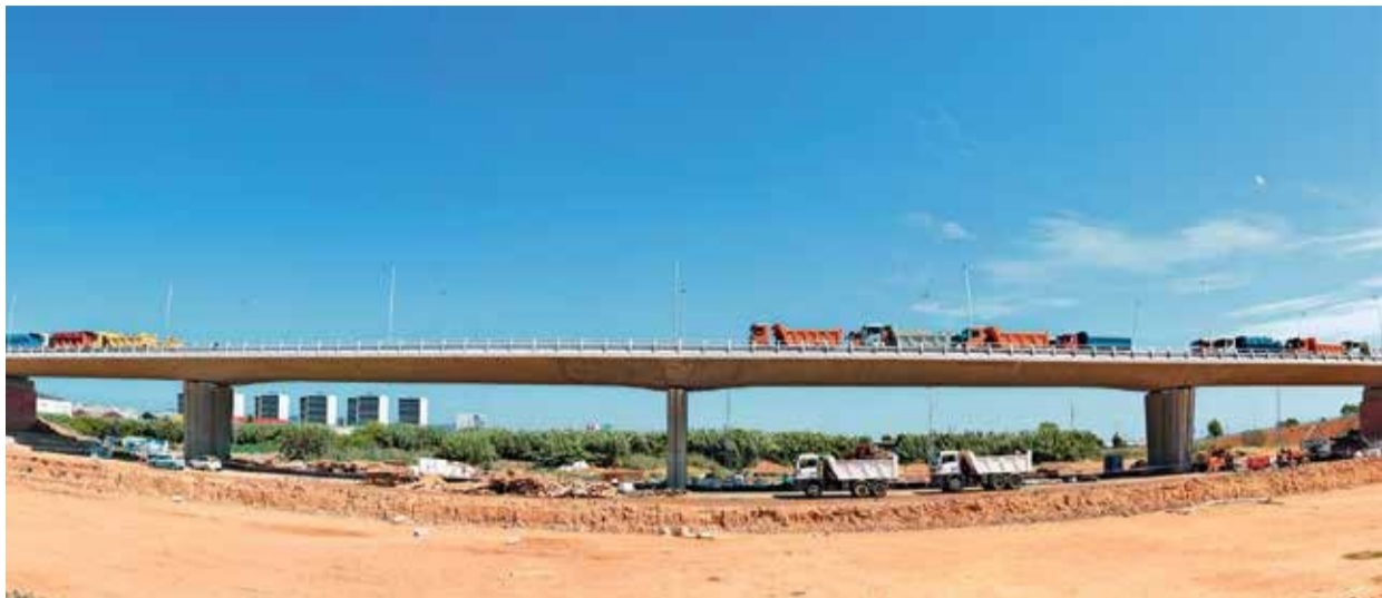
Desfile de camiones en las obras de adecuación del solar de Ca n'Alemany

De los Austrias a los Borbones y a la inversa. No como la República Veneciana, por ejemplo. Siempre de "Herodes a Pilatos", pero con malestar. Sin la necesaria autocrítica y como decía Tarradellas: "En política no se puede hacer el ridículo", camino de ello, porque si Mas y Junqueras triunfasen, -Cataluña-sería una gran zona franca, para contrabandear y jugar en casinos las 24h del día, con el agua, la energía y las comunicaciones en manos galas. Con muchos funcionarios y prácticas políticas más propias de Albania que de Dinamarca. Por lo cual habría: aduanas, ejército, aviación militar y por supuesto marina de guerra, en esto sí superaríamos a la envidiada y austera Suiza.