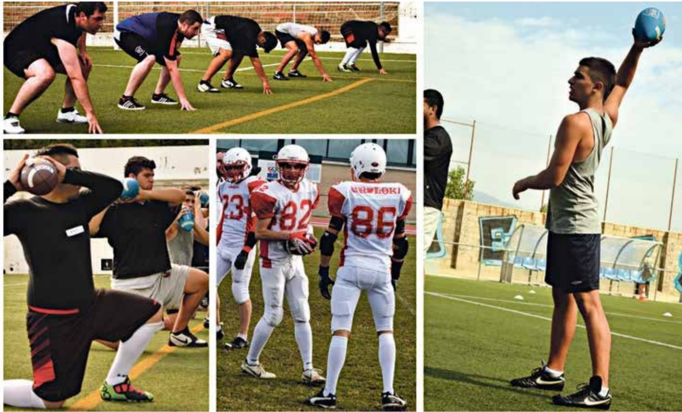
tar por esta otra vía después del fin de los Barcelona Dragons | Imágenes cedidas por Natalia Vázquez