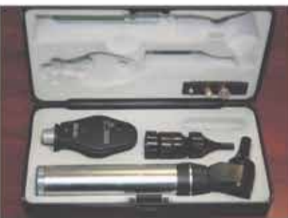
Lote 79 Set de oftalmoscopio y otoscopio KEELER