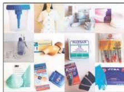
Lote 106 Productos sanitarios