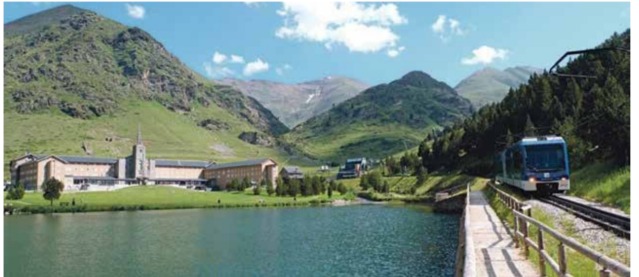
A l'estiu, el verd dels cims de 3.000 metres dels Pirineus deixen aquesta postal majestuosa de Núria

Entre altres activitats, FGC proposa aquest any l'excursió des del baixador de Fontalba a Núria, una combinació de passeig en cremallera i senderisme; un viatge d'època amb la pujada a la Vall amb el