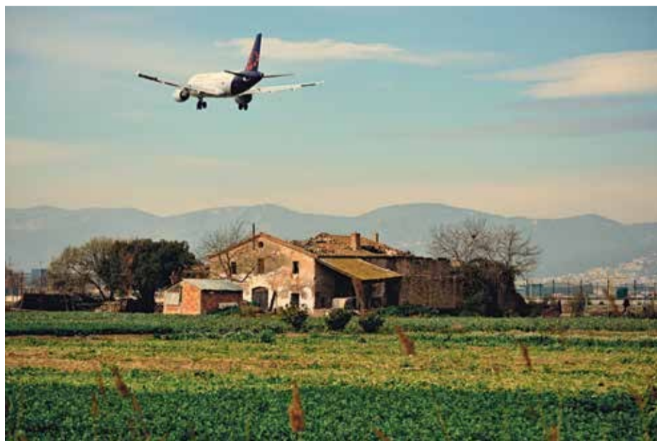
El Delta viu enmig de grans infraestructures com l'aeroport o el ZAL i envoltat d'una de les ciutats grans de la comarca: El Prat de Llobregat | Sergio Crespo

segurament el municipi més difícil de ser planificat." Ara Tejedor ja porta vint anys planificant el Prat. Seria lamentable que, a l'hora dels balanços finals, el platet de la balança del que s'ha destruït acabi pesant més que el platet de la balança del que s'ha construït.