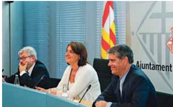
La xarxa estarà activa l'any 2017 gràcies a la col·laboració de Mercabarna, Ecoenergies i l'Ajuntament de Barcelona

D'aquesta manera, es millorarà l'autosuficiència energètica –ja que s'aprofita el fred residual d'un altre procés ja actiu al Port- però, també, el nou sistema permetrà reduir l'emissió de diòxid de carboni, així com l'energia emprada. Els costos de les empreses es reduiran, segons es calcula, en un 30%. A Mercabarna hi ha la major concentració d'Espanya de fred industrial (800.000 m 3 ), i això