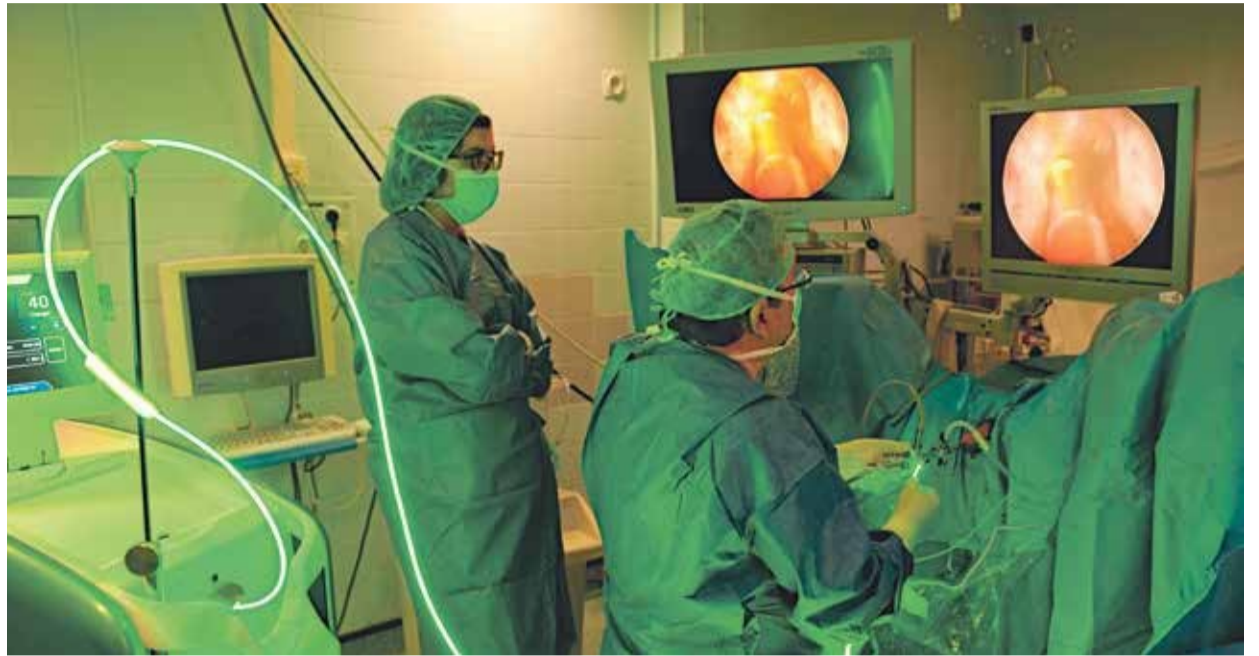
Bellvitge ha conseguido perfeccionar la técnica hasta convertirla en una intervención ambulatoria

Esta patología es la enfermedad más común