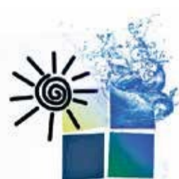
Fundación Marianao Sant Boi

Gracias a PAH, se ha centrado el debate de la dación en pago, se ha avanzado en el caso de los alquileres sociales y se ha conseguido sancionar a los bancos con pisos vacíos.