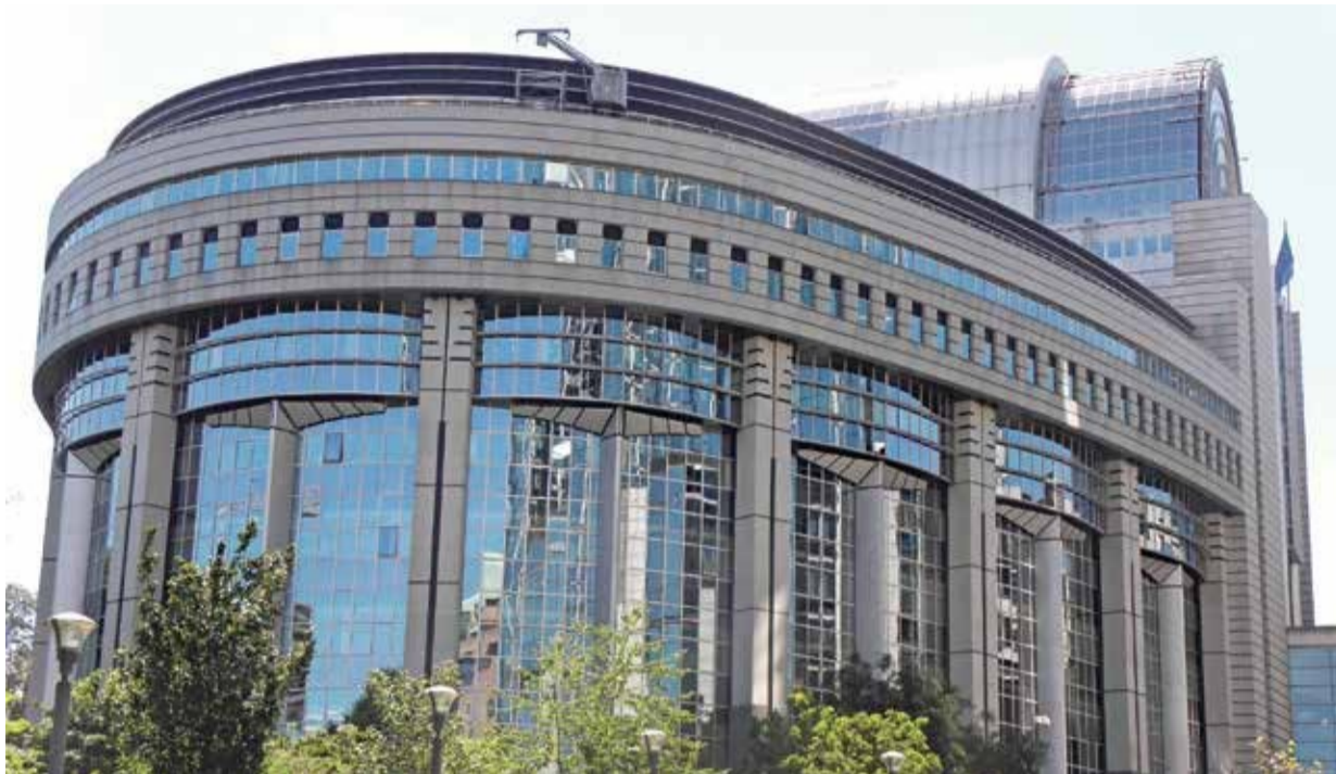
El Parlamento Europeo, con su sede principal en Bruselas (Bélgica), tiene una importancia creciente en la legislación de cada uno de los estados miembros pese a las actuales debilidades estructurales de la UE

Se precisa, por tanto, más integración y unidad. Integración sobre todo en la unión económica y monetaria, además de la unión bancaria.