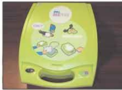
Lote 68 Desfibrilador automático ZOLL AED+PLUS