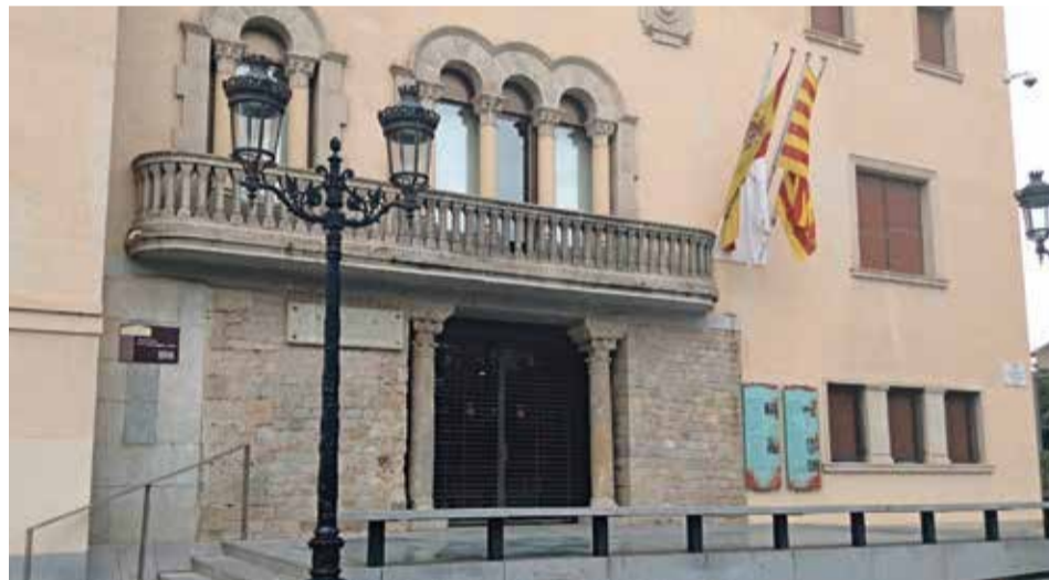
Cornellà es la ciudad con mayor población de la comarca

En este juego de balanzas, la respuesta del gobierno socialista de Antoni Balmón a la caída de los ingresos fue una reducción abrupta del gasto municipal en 2012. Cornellà pasó de gastar 89.100.035 euros en 2010 a 75.328.397 en