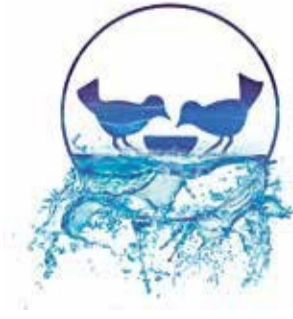
Banco de Alimentos Baix Llobregat

Depana fue uno de los grandes opositores a la ampliación del aeropuerto y al desvío del río en su desembocadura, el conocido Plan Delta hace justo veinte años.