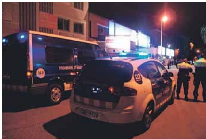
La presencia de Mossos es fundamental en Famades por donde pasan 3.000 jóvenes cada fin de semana

Respecto a los efectos de la crisis, el portero comenta que no se nota mucho. "Al ser un público muy joven, de 18 a 20 años, buscan por todos los medios los 10 euros para salir de fiesta". No todo el mundo puede entrar en la discoteca, ya que los controladores se encargan de filtrar a los clientes, que no deben ser agresivos, han de comportarse correctamente, ir vestidos y sin estar bebidos.