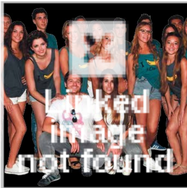
Los aspirantes luchan por ser el nuevo modelo del año | BCN Content Factory

Aunque no tienen escuela como tal, se encargan de su formación: "les guiamos y asesoramos y les enseñamos a posar y desfilar, prepararlos en definitiva para competir con