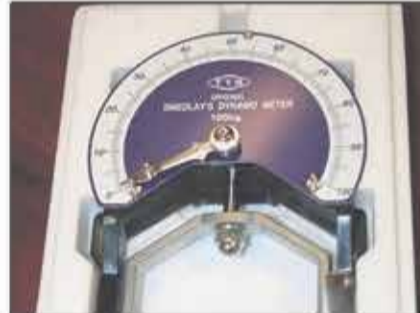
Lote 77 Dinamómetro SMEDLEY 100KG