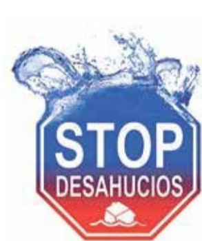
Plataforma Afectados por la Hipoteca Baix Llobregat - Norte Baix Llobregat

Siendo la mayor fábrica de la comarca, su apuesta 'verde' sirve de ejemplo en el sector.