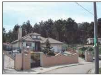
Lote 56 Vivienda unifamiliar en vidreres