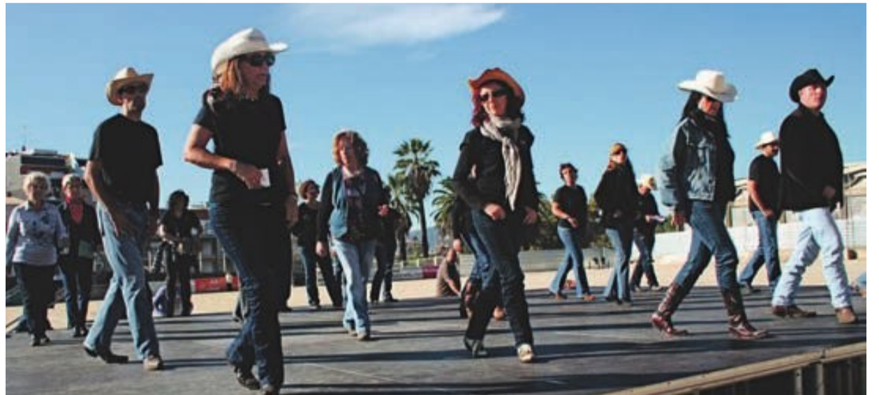
El Country Catalán participa en las competiciones de Cavaillon (Francia) y Voghera (Italia)

Hay registradas hasta 2.000 coreografías distintas del estilo 'country'