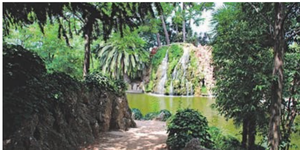
El Parc de Torreblanca és, possiblement, el més bonic de la comarca