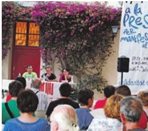
Las protestas vecinales continúan para parar el plan y liberar a los imputados

de 2005. Desde 2006 y especialmente en 2007, la campaña de protesta se convirtió en un movimiento civil crítico de alcance metropolitano que, bajo el lema "Todo está fatal, pasamos a la acción", pretendía denunciar la especulación y protestar por "la destrucción del territorio a través de la construcción de infraestructuras destinadas a favorecer las manos privadas".