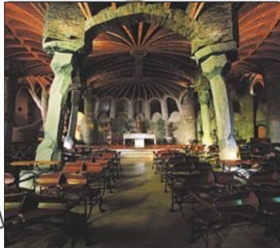
La Cripta de Gaudí a la Colònia Güell és la herència d'un projecte com el de la Sagrada Família