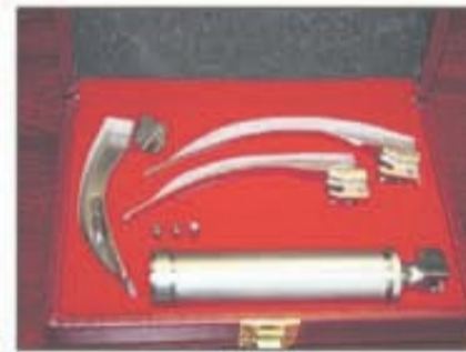
Lote 78 Laringoscopio con palas de acero