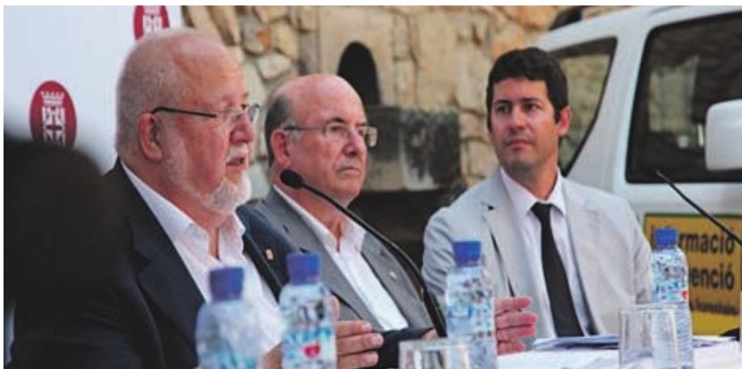
El president de la Diputació de Barcelona, Salvador Esteve, ressalta els bons resultats obtinguts en les campanyes dels darrers anys

amb la prevenció i la intervenció immediata en cas d'incendi forestal.