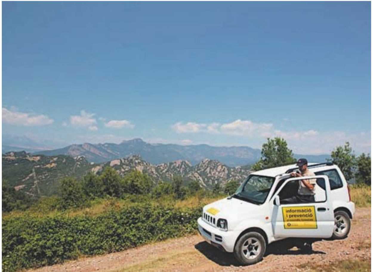
El Pla té com a finalitat principal d'evitar els incendis i limitar-ne els seus efectes | Diputació de Barcelona

D'altra banda, el president de la Diputació també posa èmfasi a la recent aprovació