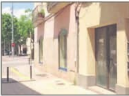
Lote 98 Venta de Local comercial en Sant Boi de Llobregat