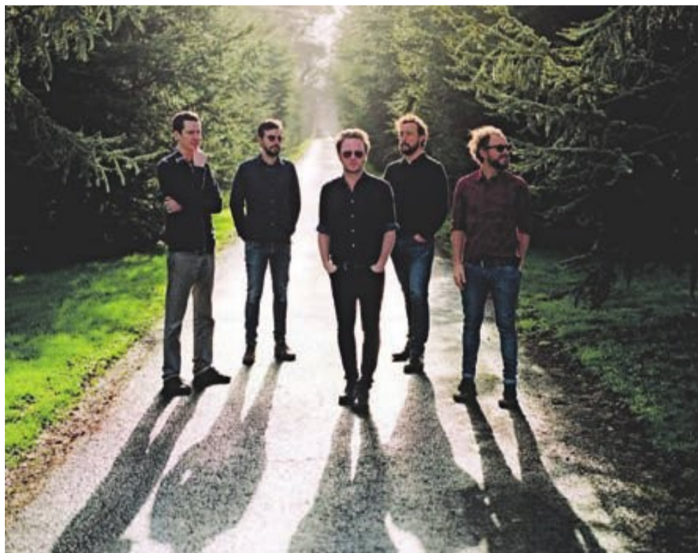
Mishima presenta ‘L’ànsia que cura’, su séptimo disco de su carrera

Durante los tres días de Festival, del 5 al 7 de septiembre, la fiesta de la música y de la canción de Sant Boi acercará a la ciudad actuaciones musicales y culturales de primera línea en los tres espacios habituales del Festival: la plaza del Ayuntamiento, Cal Ninyo y los Jardines del Ateneu Santboià. Además de todo este elenco de artistas, el público tendrá la ocasión de ver en directo a los finalistas del Altaveu Frontera, la sección competitiva para bandas noveles y grupos emergentes, que año tras año sorprenden al público del festival. Este año podremos ver las actuaciones de Malachi Estéreo, Cariolà, Pedro Parque o Xebi SF.