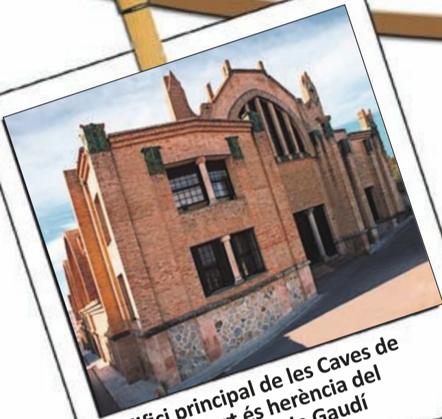
L'edifici principal de les Caves de Roger Goulart és herència del post-modernisme de Gaudí