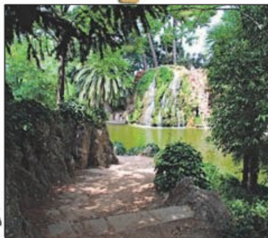
El Parc de Torreblanca, de dotze hectàrees, és un pla perfecte per anar amb la família