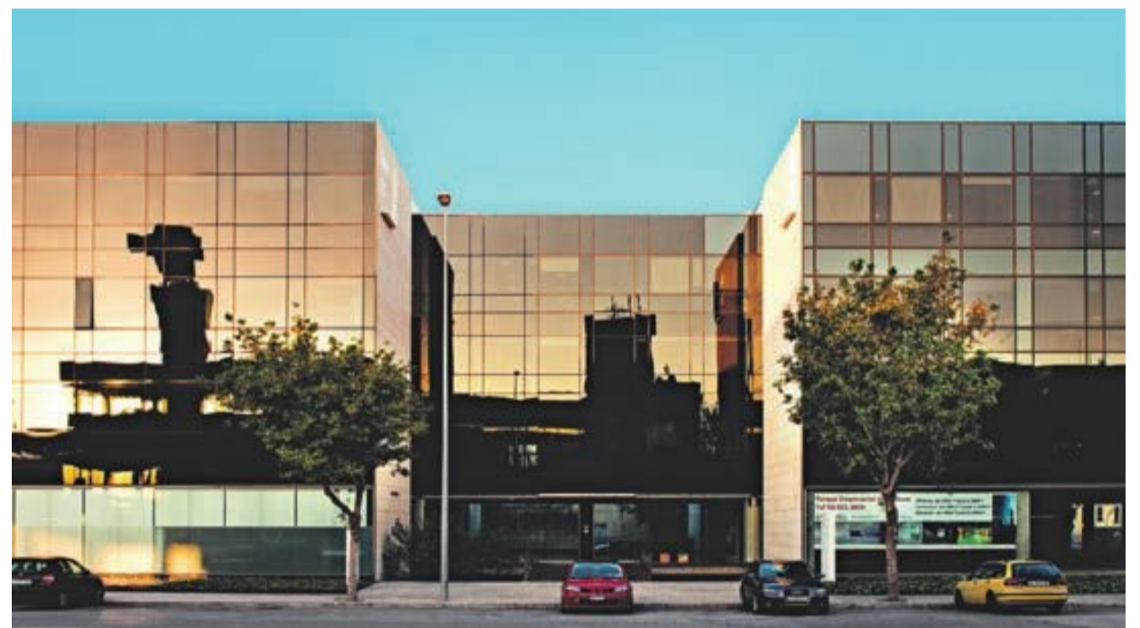
El nuevo edificio de Bundó Display cuenta con 750 metros cuadrados