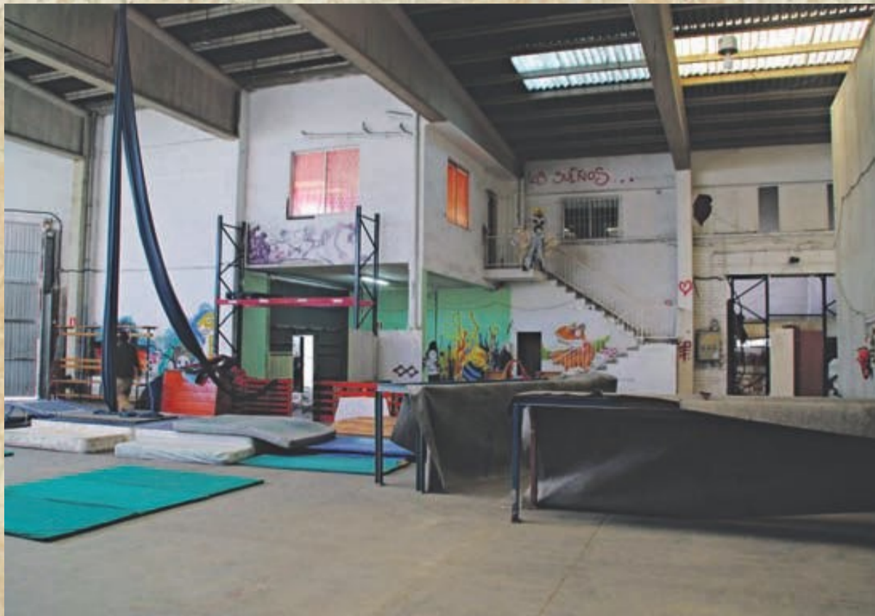
Interior de Camykaz de Cornellà, inaugurat com a CSO el 2011