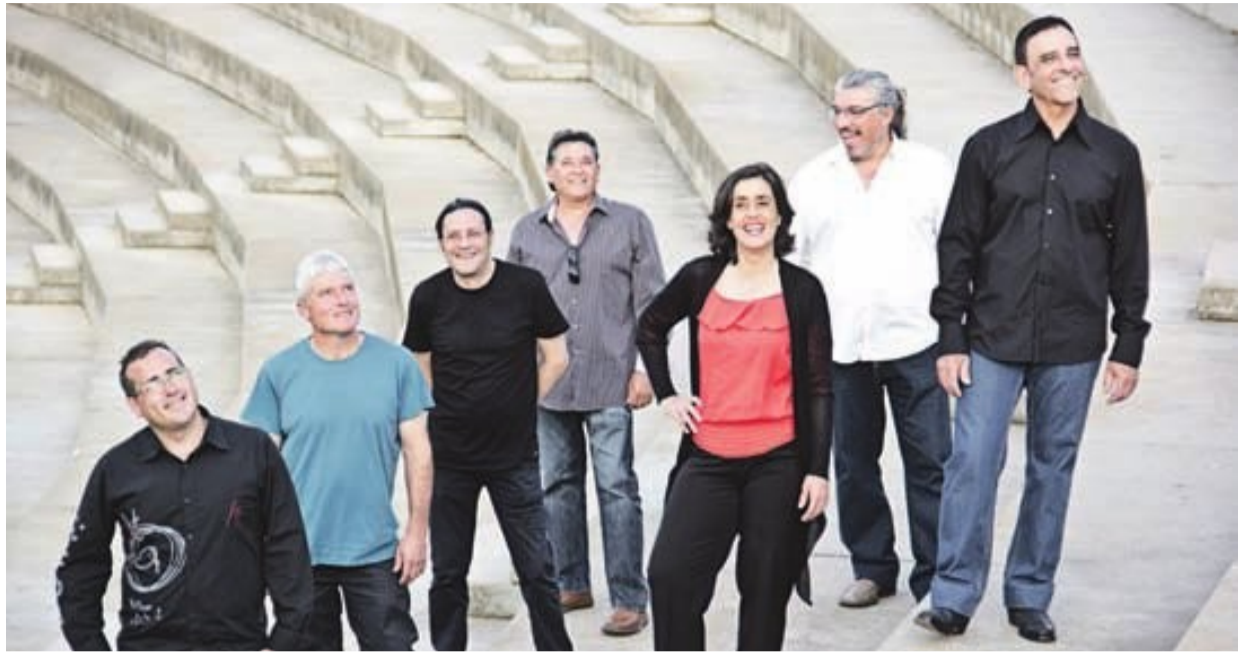
Los siete integrantes de ‘El Reencuentro’ versionan los clásicos de la rumba y el flamenco adoptando su propio estilo tanto en el cante como en lo musical