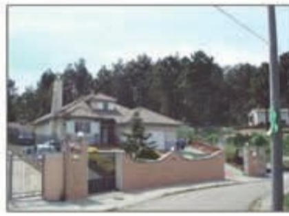
Lote 56 Vivienda unifamiliar en vidreres