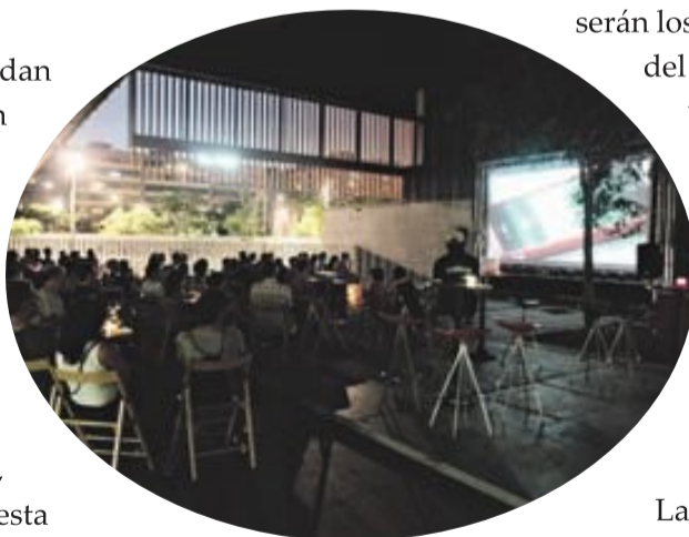
El patio del Cèntric acoge este festival de nuevos directores | Ajuntament El Prat Llobregat

Promocionar a los jóvenes artistas es el objetivo de este Festival en el que se han presentado, para esta edición, más de 150 propuestas. Al final, dieciocho cortos seleccionados