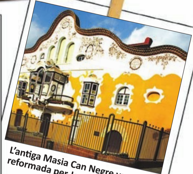
L'antiga Masia Can Negre va ser reformada per Josep M a Jujol

|| La petjada del modernisme, l'herència del món industrial a la comarca, l'afició al vi i el cava amb set municipis considerats de la D.O del Penedès, el Parc de Torreblanca que abraça a tres municipis i, fins i tot, el Barça són alguns dels atractius que es poden trobar al Baix Llobregat. Lluny de la massificació de la gran ciutat, la comarca ofereix una oportunitat perfecte per gaudir d'altre tipus de turisme on les opcions són infinites, per tots els públics, de totes les edats i gustos.