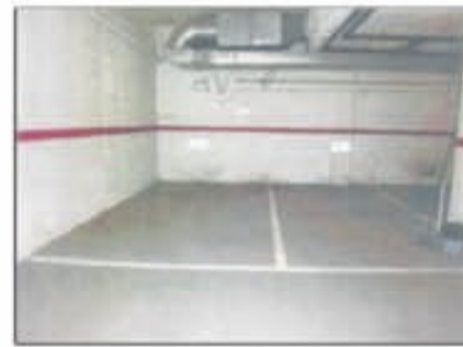
Lote 109 Plaza de Parking en venta, en Santa Coloma de Gramanet