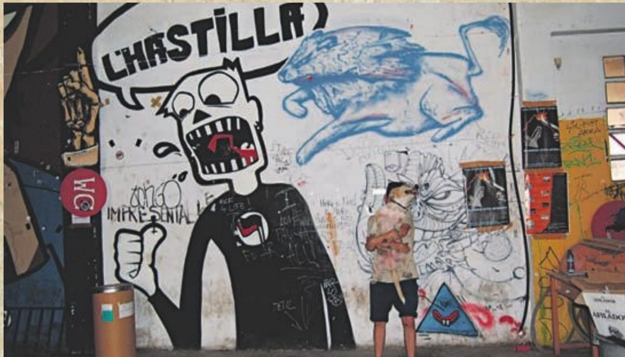
Els joves i la reivindicació són els dos pilars fonamentals de l'Astilla de L'Hospitalet