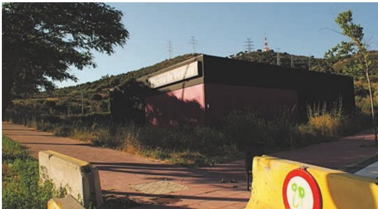
Este es el estado de abandono del terreno del Plan Caufec y de su Oficina de Ventas

irregularidades jurídicas contenidas en el Plan Caufec. Transcurren años de reformulación del proyecto hasta una segunda versión encabezada por la familia Sanahuja, propietaria de la empresa Sacresa, que compró el proyecto e hizo una segunda versión rebautizado como Porta Barcelona. Esta nueva versión del proyecto urbanístico planeó 600 viviendas de alto standing y de lujo, dos rascacielos de 105 metros de altura con un parque empresarial, un hotel de 4 estrellas y el centro comercial más grande de la vertiente norte de Barcelona.