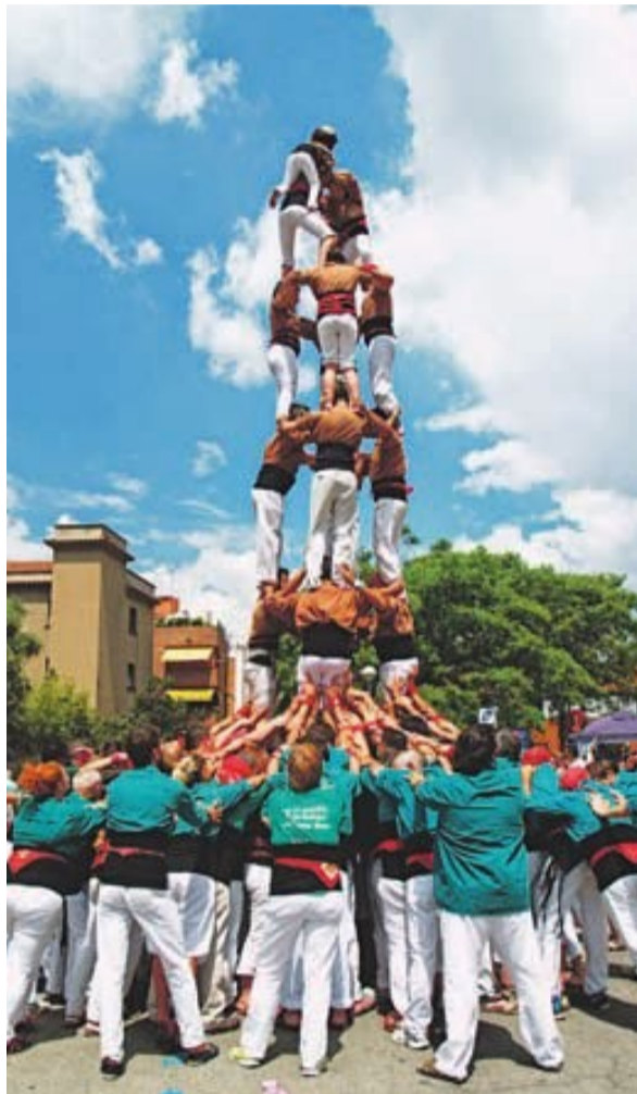
Els Matossers de Molins han celebrat recentment el seu XII Aniversari

Segons el llistat oficial de la Coordinadora de Colles Castelleres de Catalunya, a les vuit colles castelleres que hi ha al Baix Llobregat—castelleres d'Esparreguera, Esplugues, Castelldefels, Cornellà, Sant Feliu de Llobregat, Sant Vicenç dels Horts, Colla Jove de L'Hospitalet i Matossers de Molins de Rei- s'han de sumar tres agrupacions en formació, tot i que ja han dut a terme nombroses actuacions: són els Castellers de Gavà, Viladecans i els Encantats de Begues. En total onze colles castelleres de trenta-un municipis (inclòs L'Hospitalet), el que la converteix, com deïem, en la comarca amb més agrupacions de tots els Països Catalans. Manté aquesta primera posició tot i la 'desaparició' de colles com la de Martorell (al 2000), la de L'Hospitalet (al 2005), Sant Boi de Llobregat (al 2007) o, la darrera, la de Sant Andreu de la Barca (al 2008).