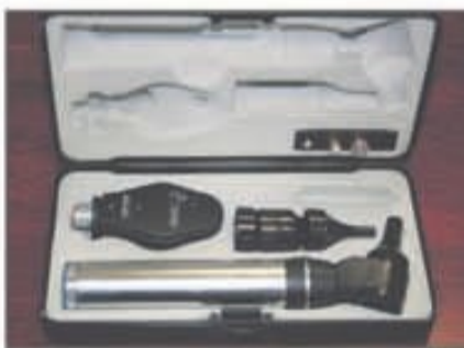
Lote 79 Set de oftalmoscopio y otoscopio KEELER