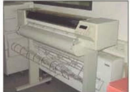
Lote 107 Plotter HP