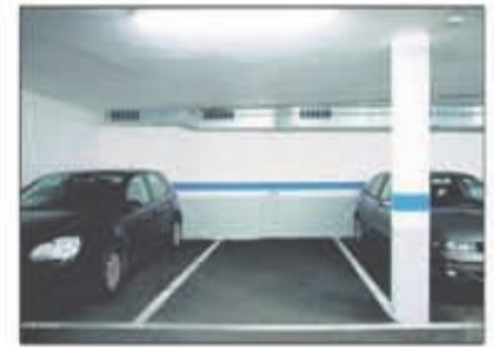
Lote 17 Plaza de Parking en Sant Boi