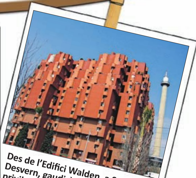
Des de l'Edifici Walden, a Sant Just Desvern, gaudiràs d'una vista privilegiada de la comarca