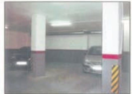
Lote 108 Plaza de parking en venta en Badalona

Todos estos lotes y más, que puede consultar en la página web, proceden de liquidaciones y subastas. Todos tienen precios excepcionales, de ocasión.