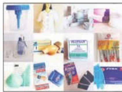
Lote 106 Productos sanitarios