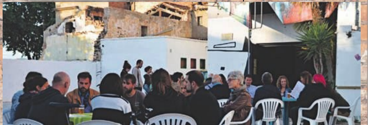
Debat ciutadà per escollir el futur de l'Ateneu

Concerts, tallers, xerrades culturals, debats socials, fins i tot, educació "lliure" es poden trobar entre els murs d'aquests espais. El context social ha afavorit que aquests CSO es converteixin en punts de trobada per la transformació social