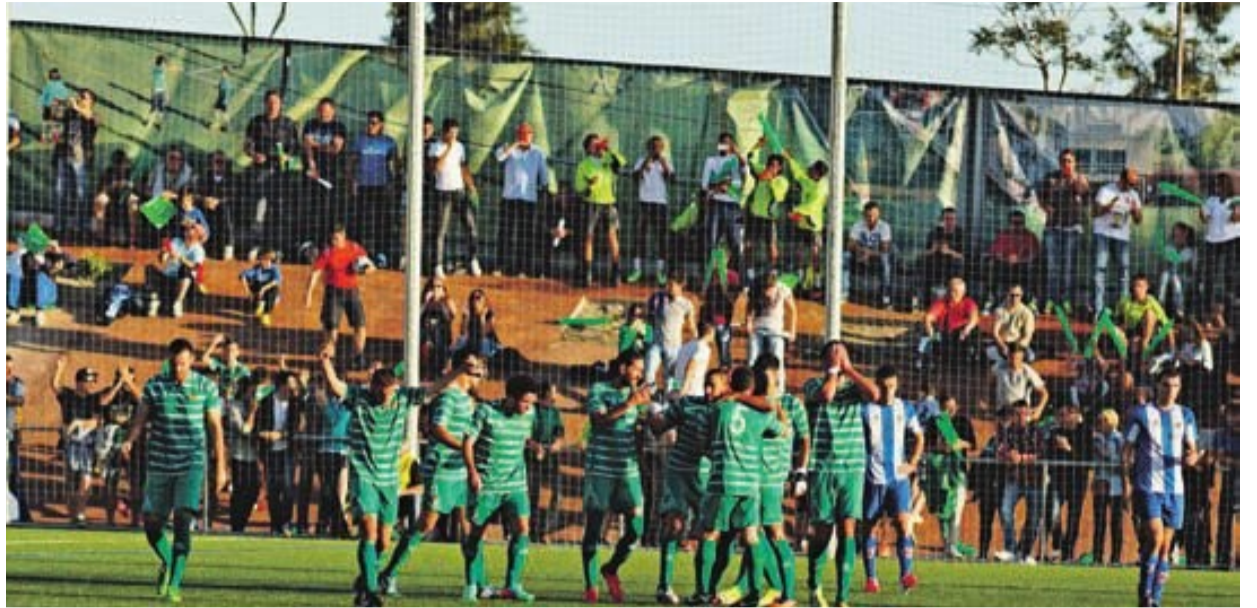
La UE Cornellà superó al Izarra de Estella (Navarra) en la primera eliminatoria, confirmando el ascenso a la categoría de bronce por primera vez en su historia