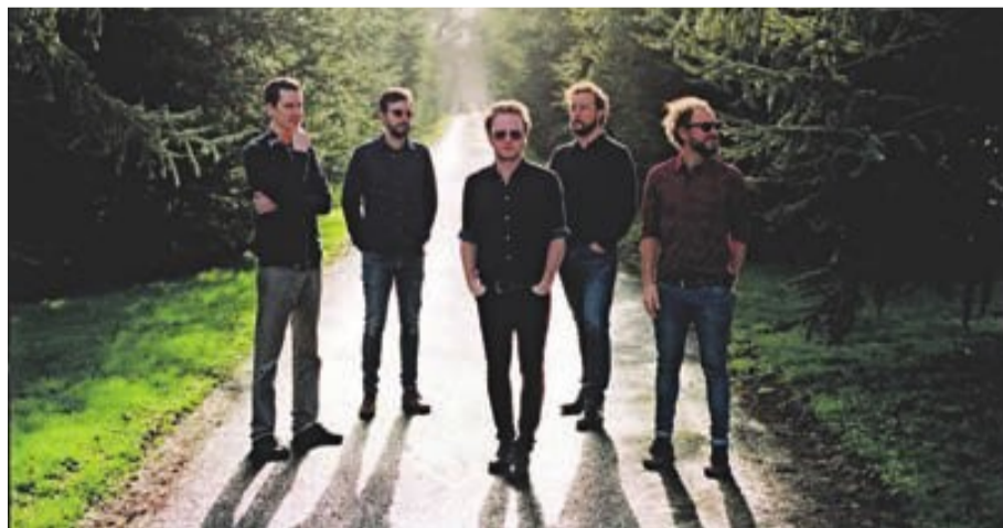
Mishima serà un dels cap de cartell del Festival Altaveu de Sant Boi