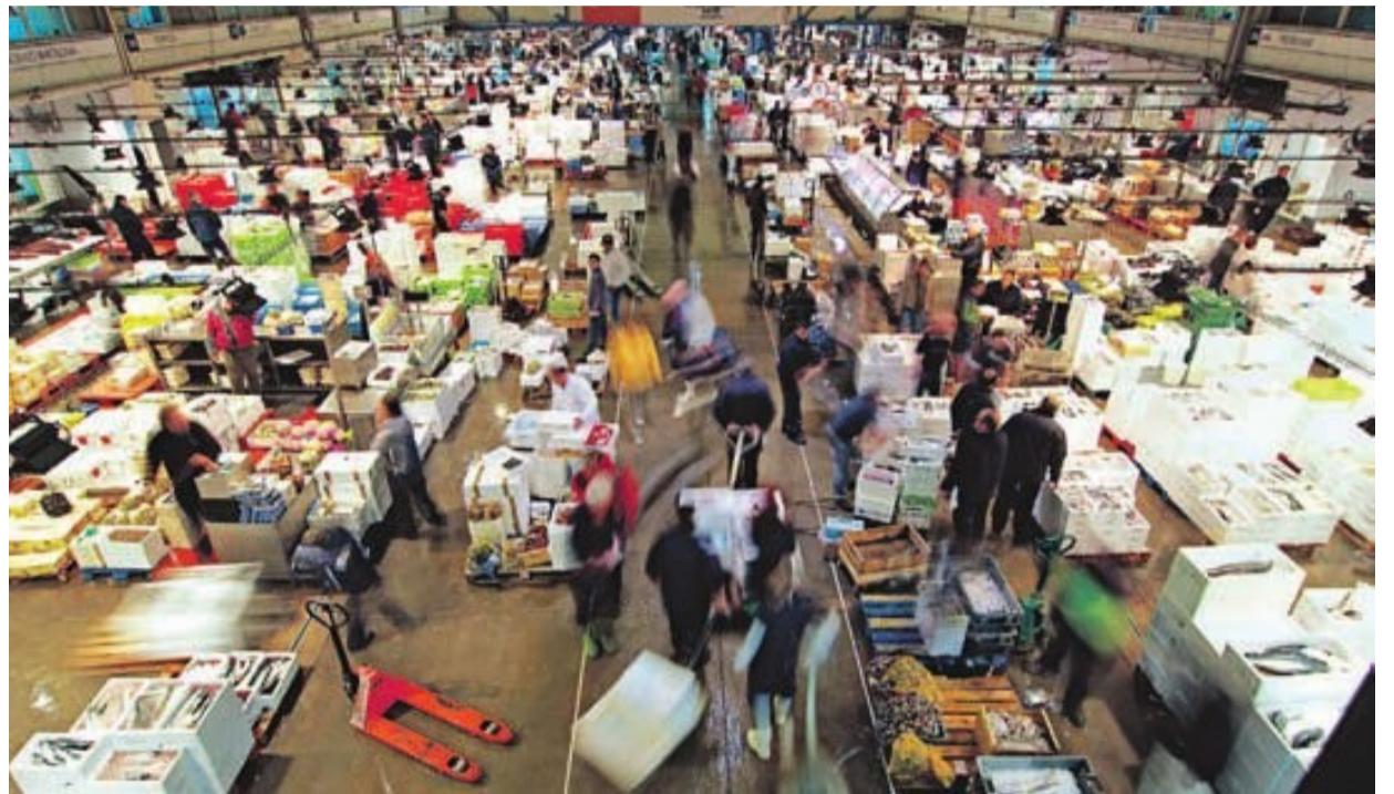
Mercado de pescado de Mercabarna

Mercabarna, que concentra los mercados mayoristas del área metropolitana de Barcelona, así como numerosas firmas de elaboración,