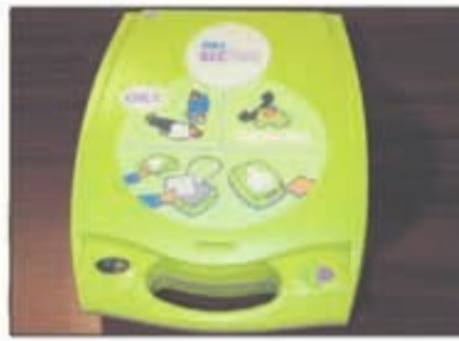
Lote 68 Desfibrilador automático ZOLL AED+PLUS