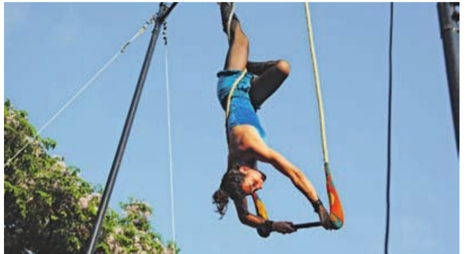
Bauala estará por primera vez en las calles de Viladecans

En un momento en que las calles de las ciudades están más huérfanas de arte que años atrás y se reducen, simplemente, a vías de paso –sin más-, este festival es una auténtica joya para la comarca. “Las artes de calle son la esencia artística por excelencia. No se entiende el teatro, la música o la danza sin entender que realmente provienen de una expresión surgida