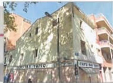
Lote 110 Edificio de viviendas en venta en Badalona