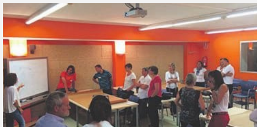
Sessió del curs

El curs va tenir molt bona acollida per part dels assistents i va ser impartit per professionals experts en esport i promoció de activitat física, que formen els col·laboradors i assessors del PNPAF. El proper mes d'octubre es tornarà a impartir el curs per donar l'oportunitat a més professionals de rebre aquesta formació. L'activitat forma part de les propostes formatives de l'Escola