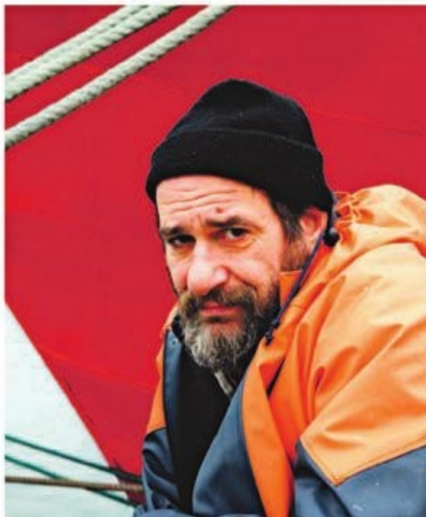
Karra reconoce imitar a su padre en su interpretación en 'Ocho apellidos vascos'

el País Vasco, que es donde tengo mis amigos, mi gente, mi idiosincrasia, mi flora, mi fauna, mis costumbres; o en Madrid, que es el centro del universo artístico-cultural. Pero bueno, mi hija vive ahí, Molins está muy bien comunicado, a 15 minutos de Barcelona, y estoy encantado de vivir en Molins. No sé si cuando los hijos se hacen mayores empiezan a pasar un poco más de los viejos, pero sí sé que yo no voy a pasar de ella, así que mucho me temo que sí me vais a tener para rato.