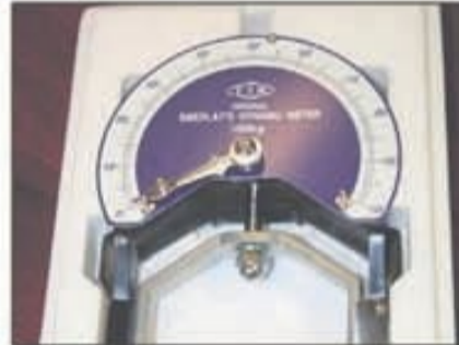
Lote 77 Dinamómetro SMEDLEY 100KG