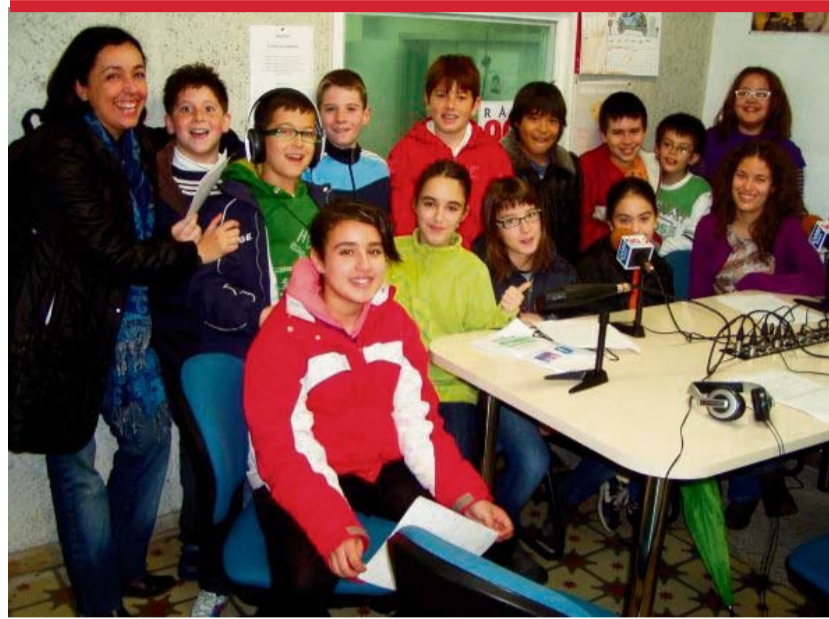
Imatge d'alguns dels alumnes que han participat enguany durant un mes al Projecte Aula Dial

La segona edició de l'Aula dial ha estat tot un èxit i ha suposat la consolidació d'aquest projecte educatiu i de fet ja es plantegen propostes a tenir en compte a la propera edició de l'Aula dial. Les novetats se centrarien en promoure la interacció de les escoles participants en aquest projecte educatiu, ja sigui mit-