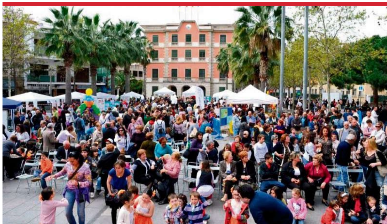
Aspecto que presentaba la plaza de la Iglesia el 3 de abril durante la celebración de la fiesta.

El pasado 3 de abril, la ONG Interlibros organizó en la plaza de la Iglesia una Fiesta Solidaria con el objetivo de recaudar fondos para la reconstrucción de una biblioteca en Tubular, en la Octava Región de Chile, destruida por el terremoto en febrero de 2010, además de fomentar la lectura entre los más pequeños coincidiendo con el Día Internacional del Libro Infantil y Juvenil (2 de abril), fecha del aniversario del nacimiento de Hans Christian Andersen.