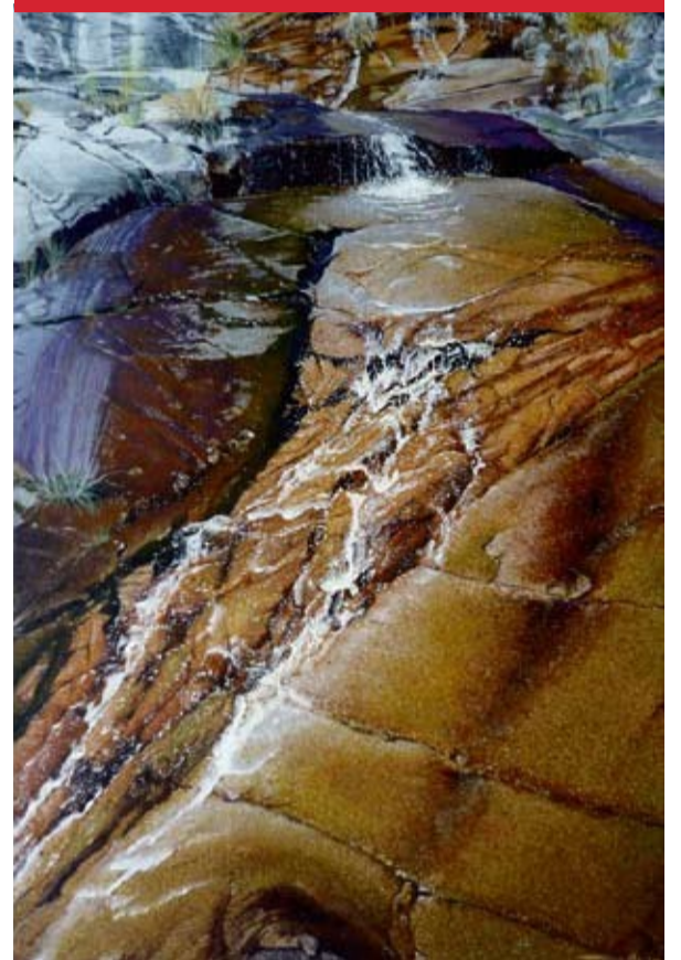
Imatge d'una de les obres d'en Cisco Colomines.

El passat dijous, 31 de març de 2011 el Ple Municipal de l'Ajuntament de Cornellà de Llobregat va aprovar una moció per adherir-se a la plataforma de somescola.cat, amb els vots favorables dels grups polítics municipals del PSC, ICV, CiU, ERC i EUiA.