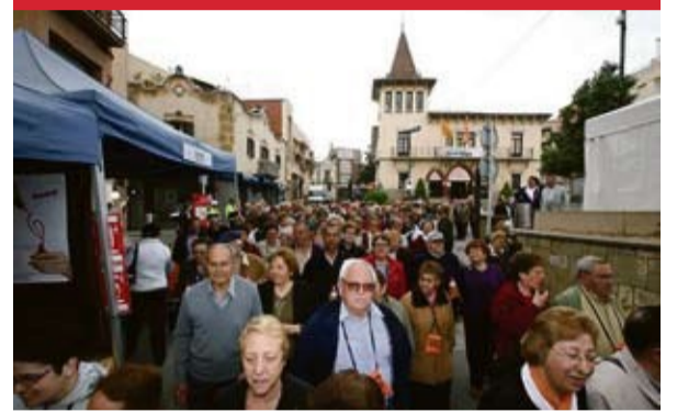
Imatge d'algunes de les persones que han participat a la Caminada del Gent Gran.

Aquest ha estat un dels actes centrals del programa que ha tingut lloc del 2 al 10 d'abril a diferents punts del municipi i que acull xerrades, mostres i campionats de jocs de taula, entre d'altres activitats.