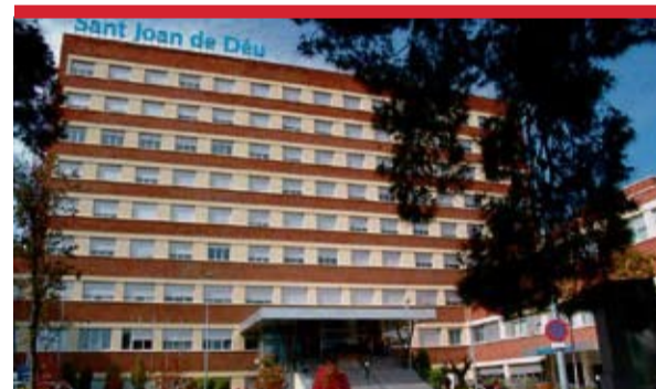
L'Hospital Sant Joan de Déu participa al disseny d'aquest nou model de motxilla.

L'Hospital Sant Joan de Déu d'Esplugues i l'empresa Miquelrius han dissenyat una nova modalitat de motxilla per tal d'evitar el dolor i les contractures a l'esquena tan sovintejades en molts nens i adolescents a causa del pes excessiu que han de carregar dia rere dia.