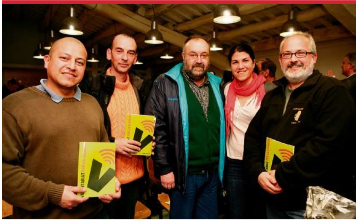
Imatge d'algunes de les persones que participen a l'edició d'enguany del Voluntariat per la Llengua.

El passat 15 de març va tenir lloc, a la sala d'actes de Ca n'Ametller, la presentació de les parelles lingüístiques que participen a la 12a edició del Voluntariat per la llengua. Prèviament a la presentació formal de les parelles, membres del Servei de Català de Molins de Rei van fer una xerrada, als voluntaris per una banda i als aprenents per l'altra, per explicar-los les línies generals del programa i l'objectiu principal de l'activitat: fer del català una llengua d'integració per a les persones nouvingudes i estendre el seu ús social.