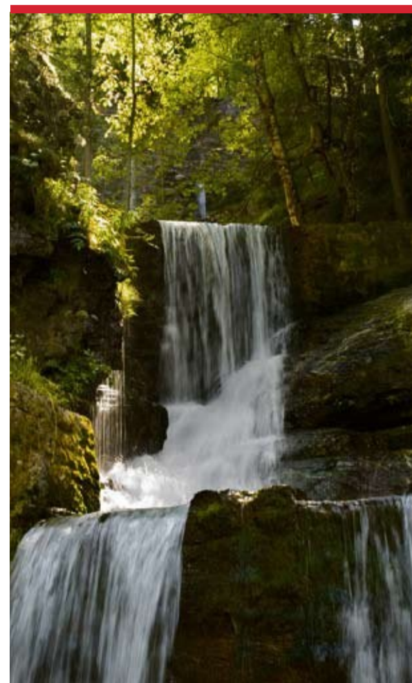
L'aigua és l'element principal del Concurs de Fotografia d'enguany