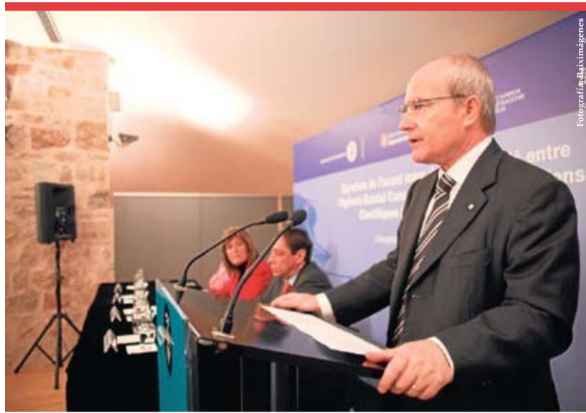
El President Montilla interviene ante la prensa durante la presentación pública del convenio entre Biopol y CSIC.

El Consell Superior d'Investigacions Científiques (CSIC) y el Consorci Biopol'H han firmado el pasado 19 de noviembre un acuerdo marco de colaboración por medio del cual grupos de investigación del CSIC se integrarán en el Biopol'H y se facilitará la construcción de un nuevo edificio en el que se ubicará el Institut d'Investigacions Biomèdiques de Barcelona (IIBB).