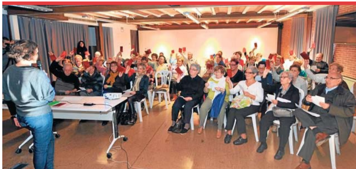
Imagen de una de las sesiones del Masterclass de memoria celebradas en Esplugues.

El Espai Baronda de Esplugues acogió el 22 de noviembre una singular sesión con las personas mayores como protagonistas. Las personas participantes en los diferentes grupos de estimulación cognitiva que organiza el Ayuntamiento de Esplugues en los ‘esplais de gent gran’ de la ciudad realizaron un encuentro en el que pusieron en práctica los ejercicios y las técnicas de memorización aprendidas durante los talleres.