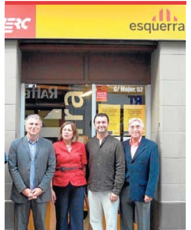
La Consellera Carme Capdevila amb dirigents locals d'Esquerra davant la seu del partit al municipi.

El mes de setembre la Consellera d'Acció Social i Ciutadania, Carme Capdevila, va anunciar en la seva visita a Molins de Rei que el projecte de la nova llar d'avis estaria encarrilat abans d'acabar l'any 2010. Així ha estat i la Conselleria i l'Ajuntament han acordat les condicions econòmiques i de finançament per a fer possible la construcció de la nova llar d'avis el més aviat possible a La Granja.