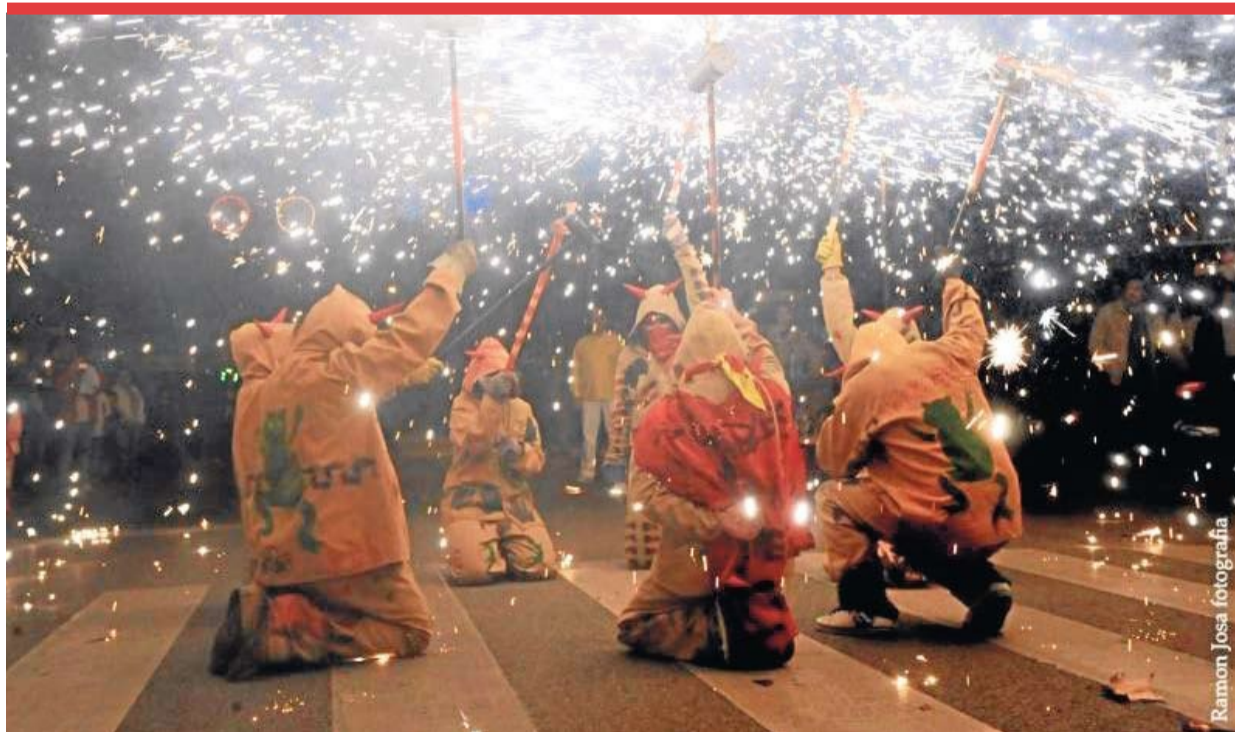
Los diablos de Castelldefels encabezando el pasacalles de la Festa Major d'Hivern.