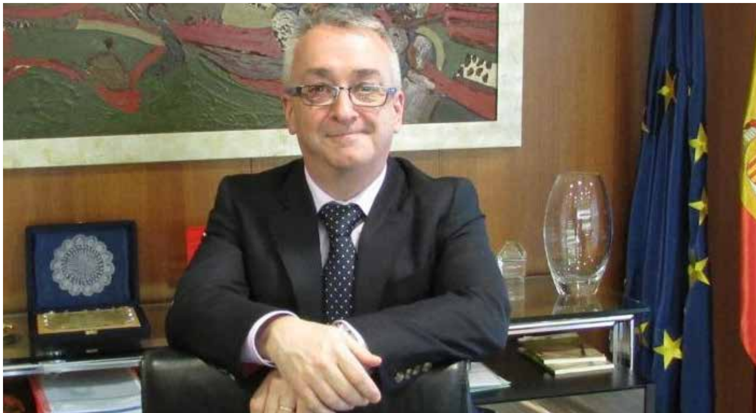
Juan Manuel Rodríguez Poo, presidente del Instituto Nacional de Estadística.