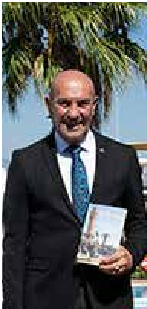
El alcalde de Izmir, Mustafa Tunç Soyer.

Desde Izmir, la problemática internacional la sufren por la deriva del presidente turco Recep Tayyip Erdogan hacia una política exterior agresiva, queriendo jugar un papel de potencia media en Oriente Próximo como recurso habitual de los regímenes totalitarios para distraer los graves problemas internos a nivel económico, social y político, con una dura represión de la libertad de expresión. En Turquía se espera con ansiedad las próximas elecciones generales para terminar con la pesadilla del islamista Erdogan.