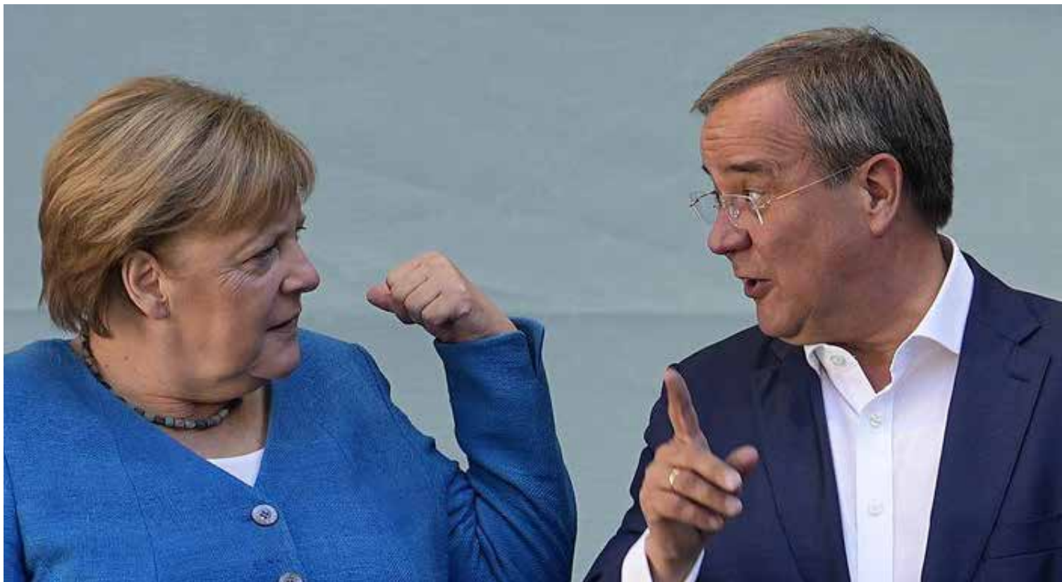
Angela Merkel con el nuevo candidato de la CDU, Armin Laschet.

líder del FDP, Christian Lindner , no han ocultado.