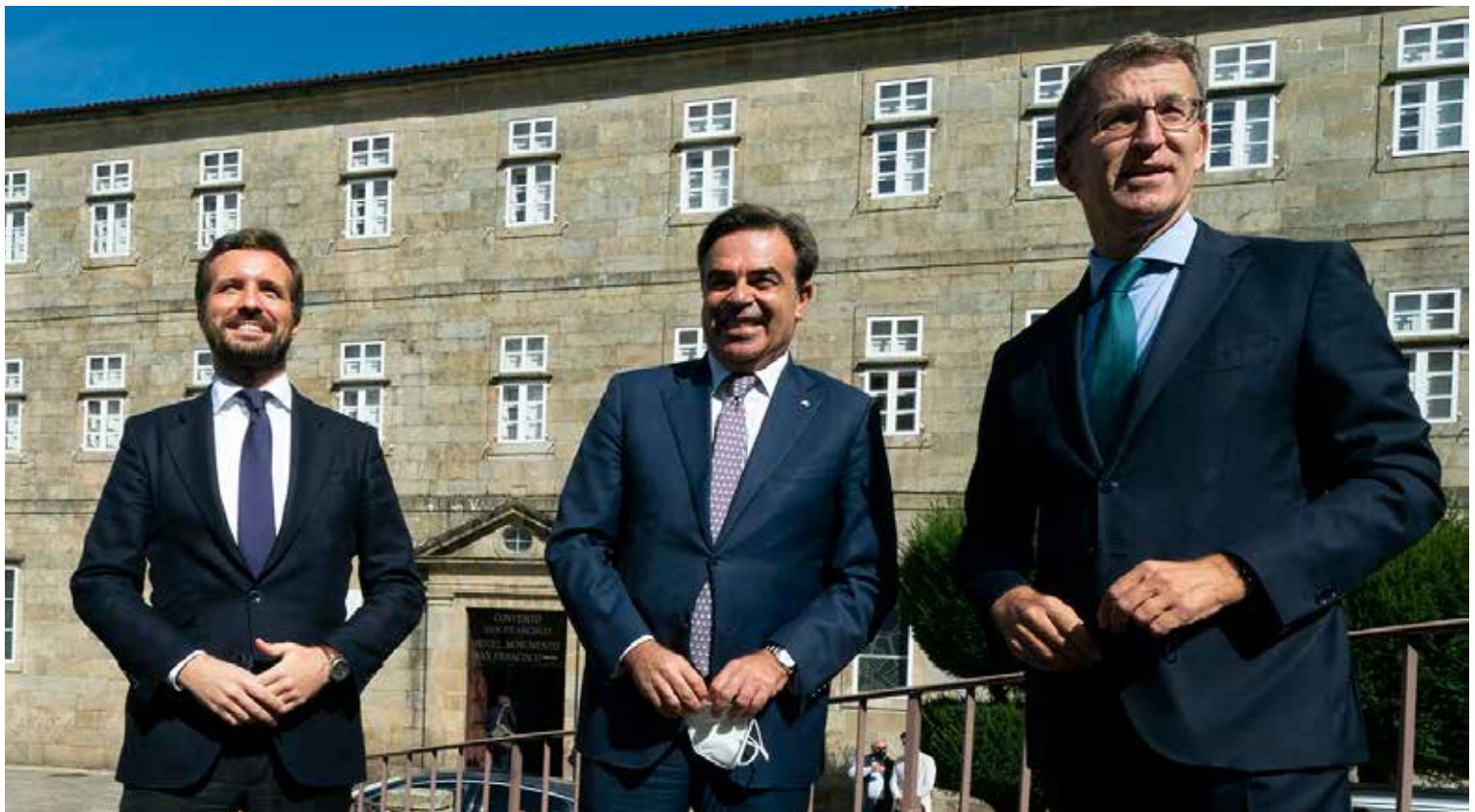
El presidente del PP con el vicepresidente de la Comisión Europea, Margaritis Schinàs, y Alberto Núñez Feijóo.

bañaban de sangre, como era de rigor, los campos de Italia, con un Fernando el Católico agazapado y dispuesto a sacar provecho de la eterna rivalidad entre los Sforza y los Médici, entre Milán y Florencia.