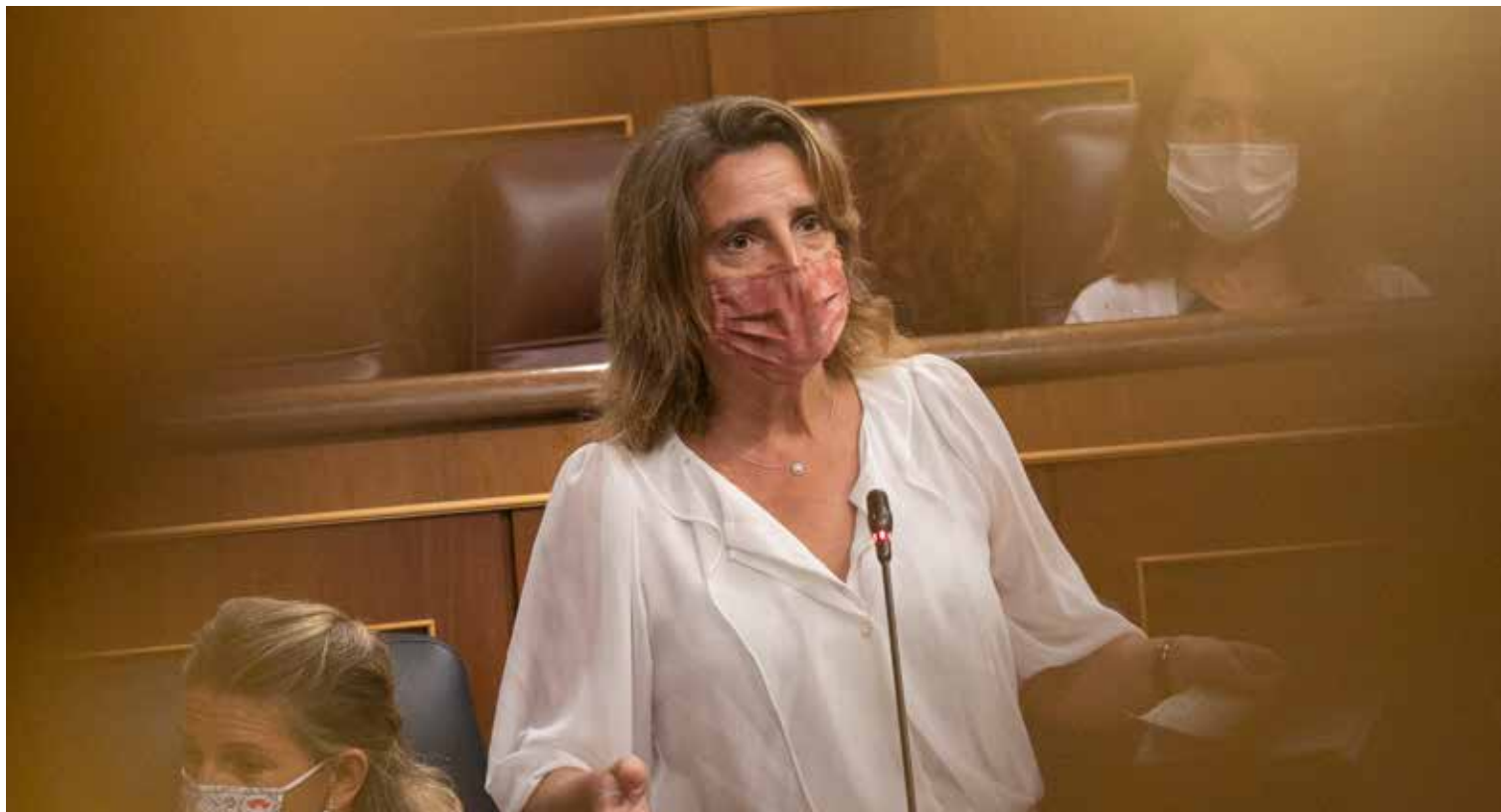
La ministra Teresa Ribera se ve incapaz de controlar las subidas de electricidad.