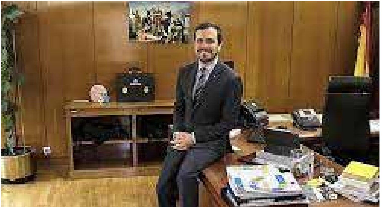
El ministro de Consumo, Alberto Garzón, no ha dicho nada de la subida de la luz.

especialmente por los incrementos del precio del gas y ahora también el del petróleo. Los políticos no pueden controlar estas situaciones a no ser que pongan límites a la libertad de comercio y si lo hacen serán acusados de anticapitalistas y hasta de comunistas.