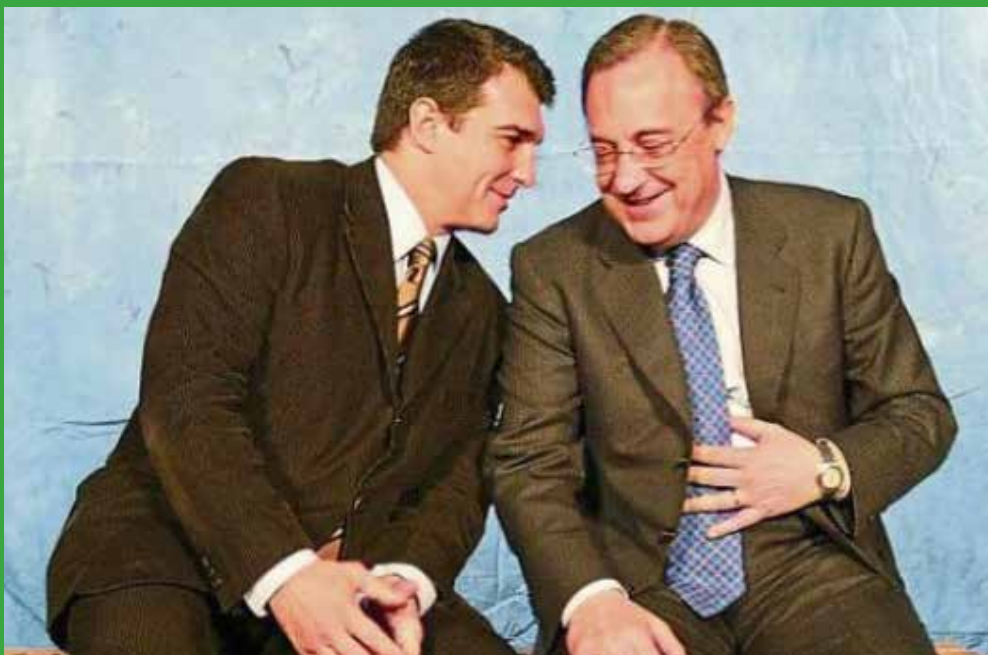
Los presidentes del Barça y del Real Madrid, Joan Laporta y Florentino Pérez.

Ni Florentino, ni Laporta son capaces de cambiar. Lo llevan en el ADN. Necesitan mandar e intervenir, por mucho que presuman de delegar en sus segundos futbolísticos que no empresariales