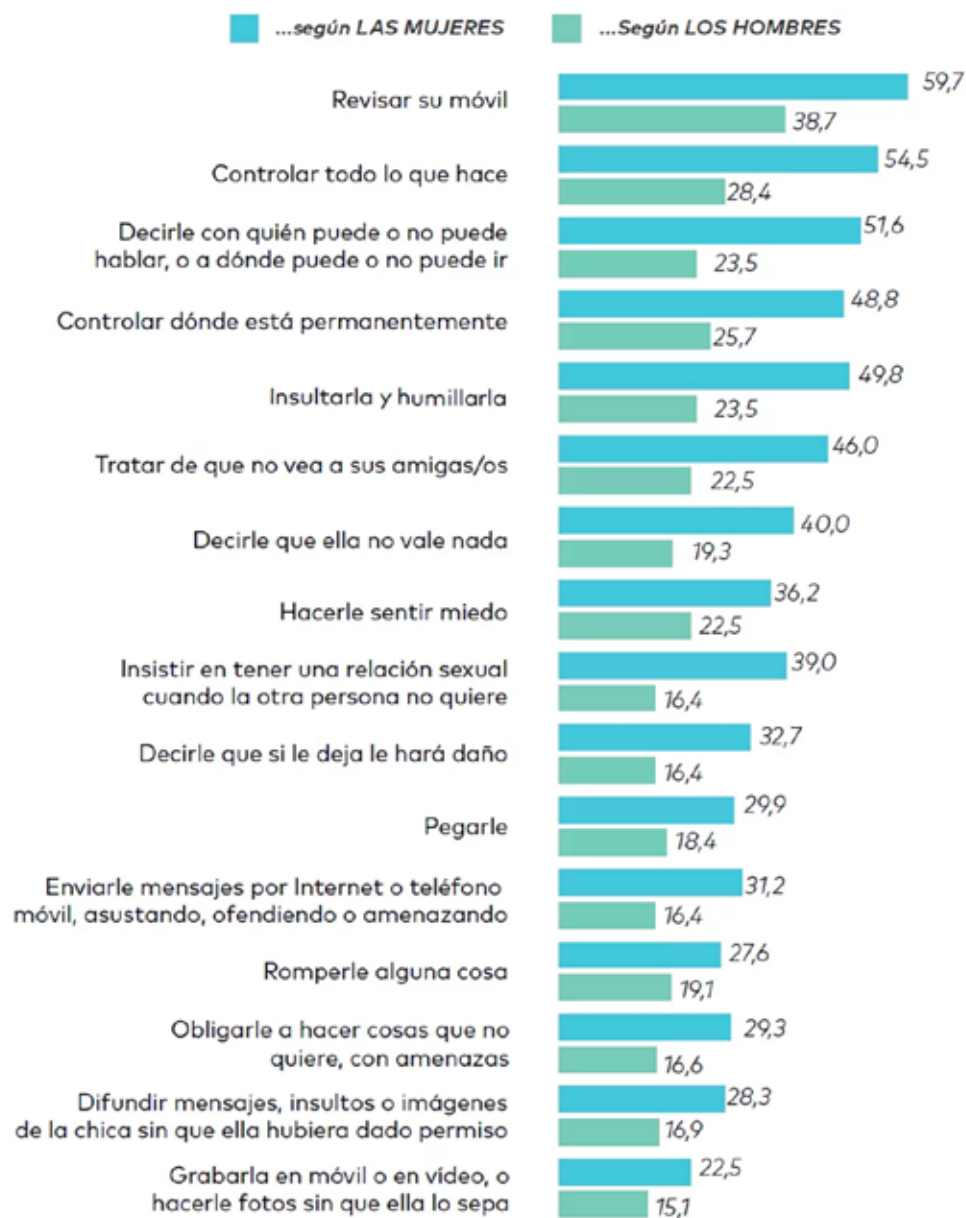
SITUACIONES DE VIOLENCIA DE GÉNERO PRESENCIADAS Respuesta múltiple. Datos en %. Base: total muestra (N=1.201)