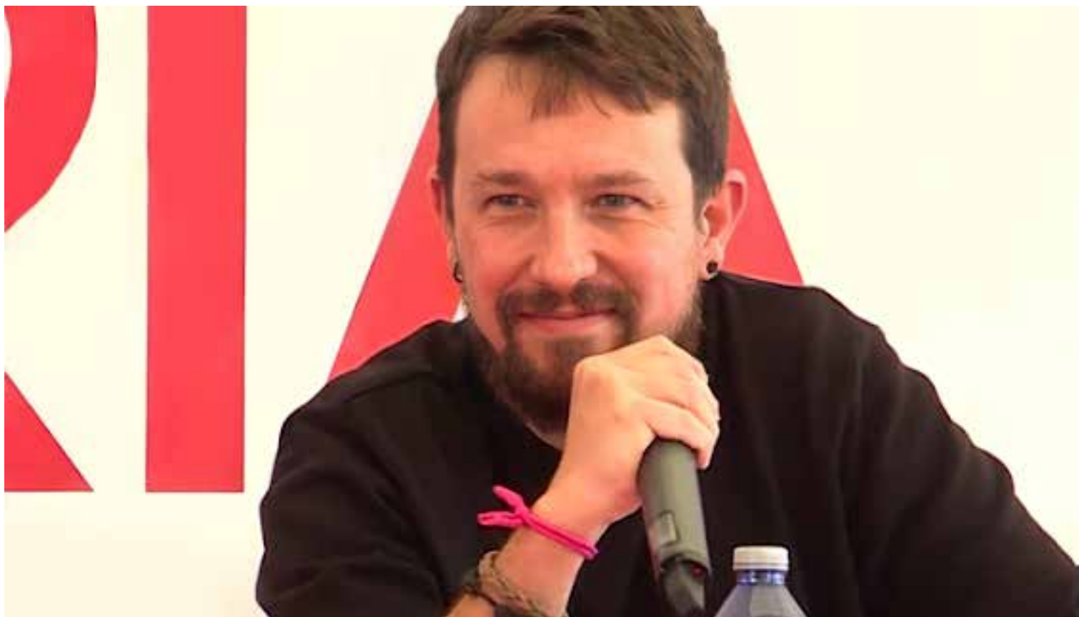
Pablo Iglesias participó en la fiesta del PCE.

rra y su propia compañera, Irene Montero . La apuesta parece clara: sin poder todo es ilusión y para tener poder hay que estar en el gobierno como sea.