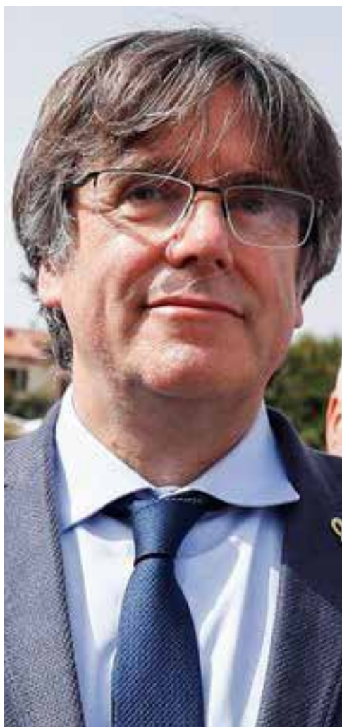
Carles Puigdemont en Cerdeña.

Leeremos mucho sobre Puigdemont y su suerte jurídica, veremos a Aragonés muy indignado y a un Gobierno central tomando distancia de la situación. Veremos, escucharemos y leeremos de todo pero al final nada ocurrirá. Si me equivoco, rectifico de inmediato.