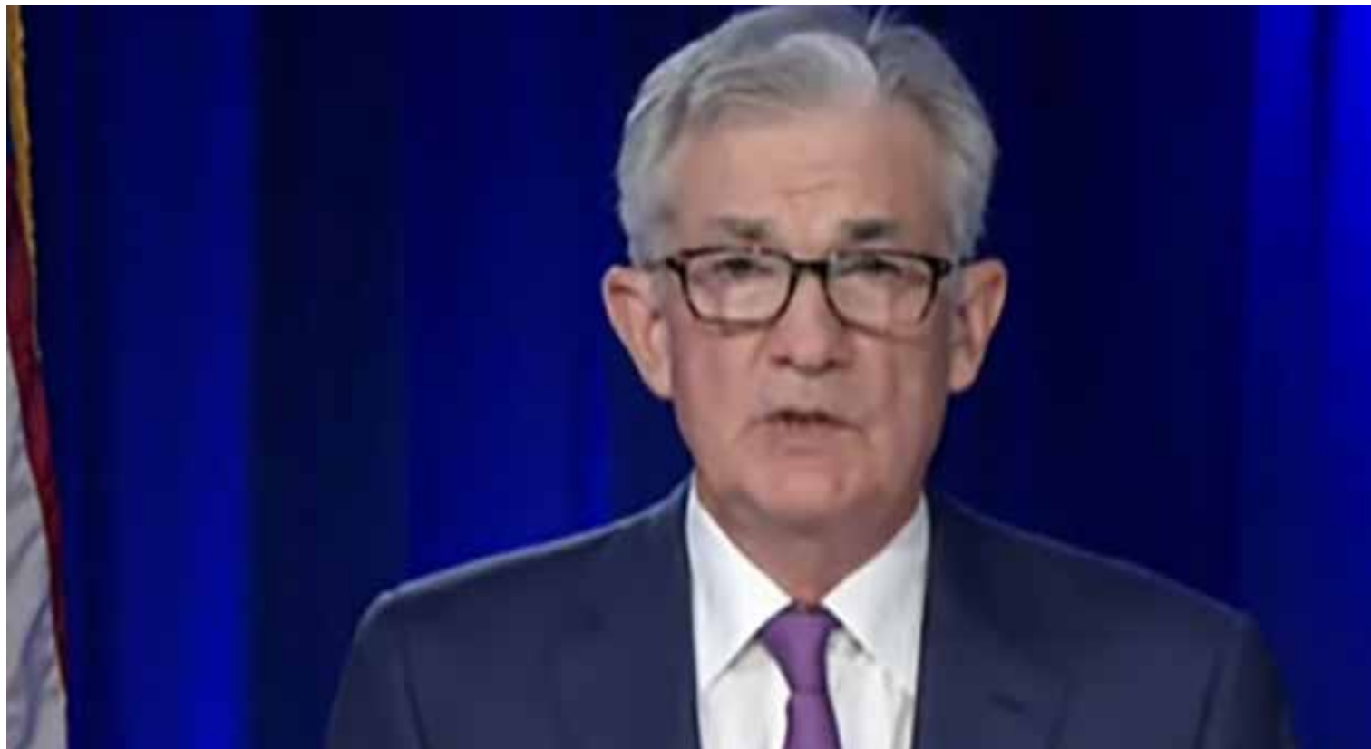
Jerome Powell, presidente de la Reserva Federal norteamericana.

ellos, y creemos, los indicadores adelantados del tercer trimestre han sido muy buenos y los de septiembre están yendo por similar camino, de modo que no tardaremos más allá de unos pocos meses en recuperar los niveles prepandemia. No vamos a especular si en 2021 como defiende el Gobierno, o a principios de 2022, pero por ahí deberían de ir las cosas.