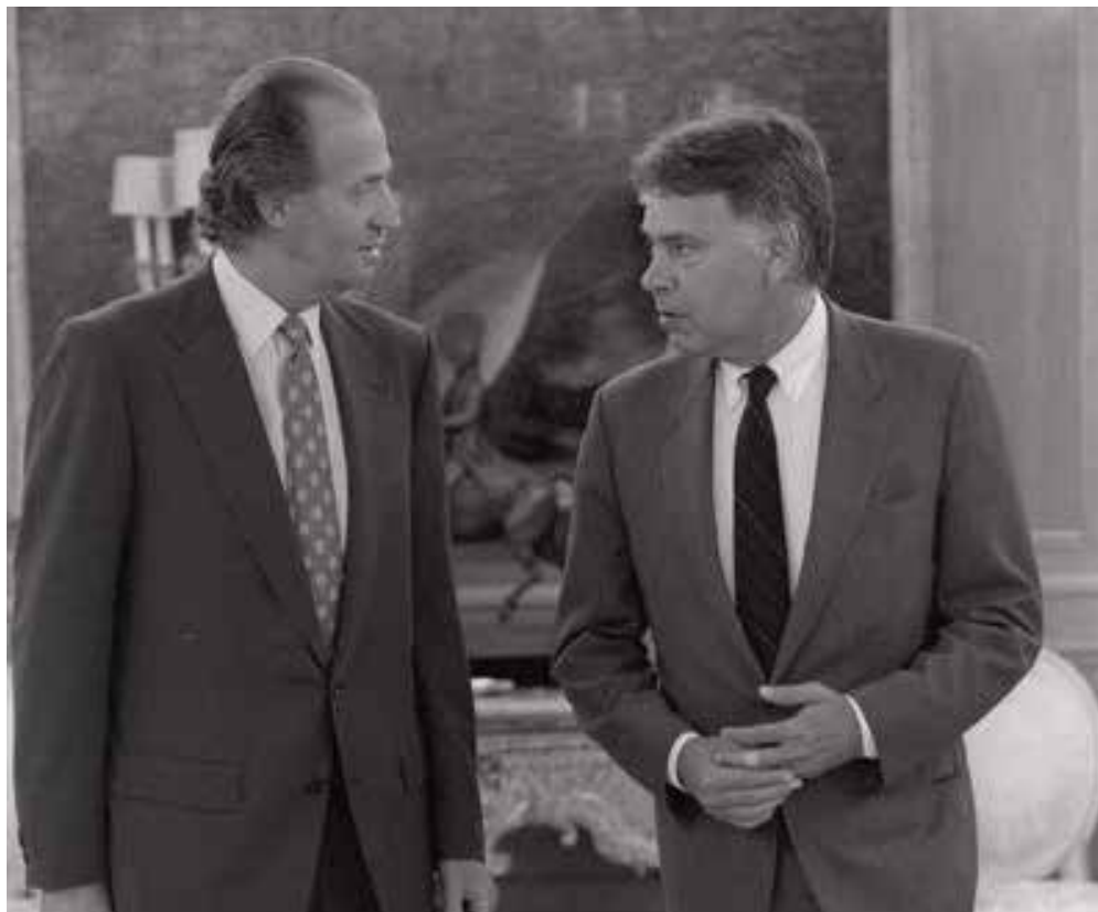
El ex Rey Juan Carlos I y Felipe González.

No se trata sólo de cambiar para que nada cambie. Gracias al editor Feltrinelli, si leemos, y al director Visconti, si vamos al cine, ya sabemos que no basta con arrojar al pobre “Bendicó” por la ventana, tras años de estar momificado como emblema familiar. Lo que hizo Giuseppe Tomasi di Lampedusa fue colocar ante los ojos de la Italia que acababa de salir de la Gran Guerra colgando a Benito Mussolini y a Clara Petacci boca abajo en la plaza Loreto de Milán un 29 de abril de 1945, tras fusilarlos el día anterior un grupo de partisanos comunistas cuando intentaban cruzar la frontera, que ese país no había cambiado, que los que insultaban al Duce muerto y a su amante eran los mismos que veinte años antes le aclamaron con entusiasmo levantando el brazo y abriendo la mano tal y como hacían los próceres romanos. Y que caído el fascismo