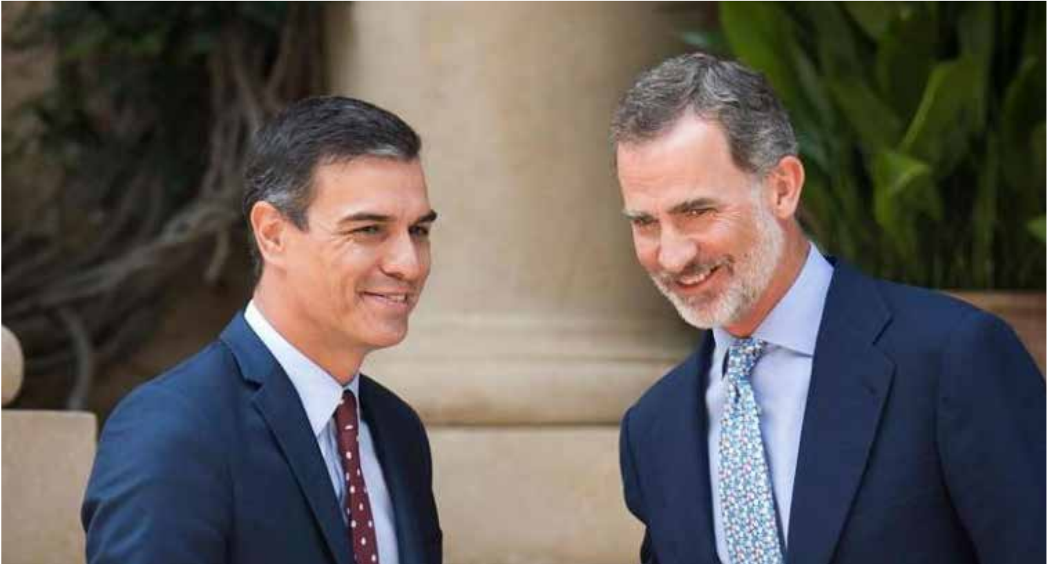
El presidente del Gobierno, Pedro Sánchez, con el rey Felipe VI.