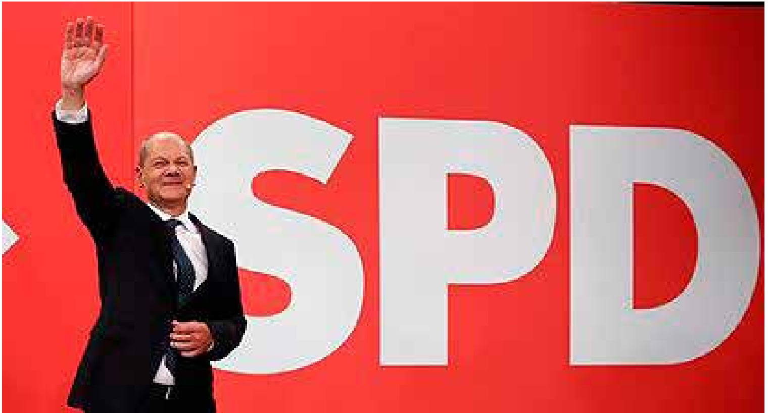
El ganador de las elecciones, el socialdemócrata Olaf Scholz.