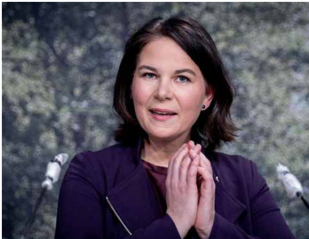
Annalena Baerбок, la lideresa de los Verdes alemanes.

Queda por ver si tanto Scholz como Laschet no tienen más remedio que buscar el gran acuerdo político que les lleva a no tener que negociar con verdes y liberales. Merkel lo hizo posible aunque tardó dos meses en conseguirlo y siempre con la premisa de que la presidencia del gobierno sería para la fuerza más votada, que en este caso han sido los socialdemó-