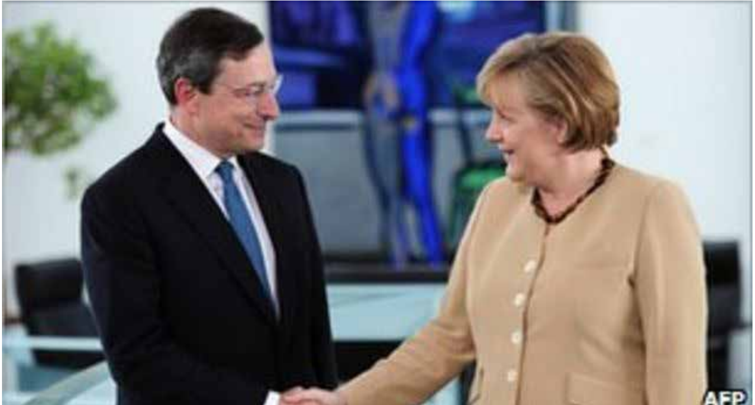
El presidente del Gobierno italiano, Mario Draghi, y la canciller alemana Angela Merkel.