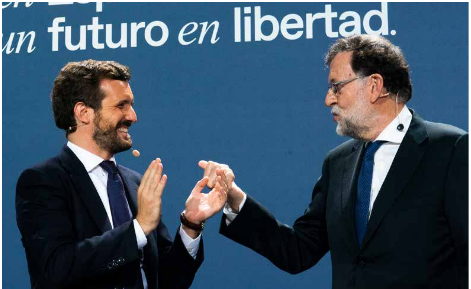
Mariano Rajoy ha acudido a la Convención del PP para mostrar su apoyo a Pablo Casado