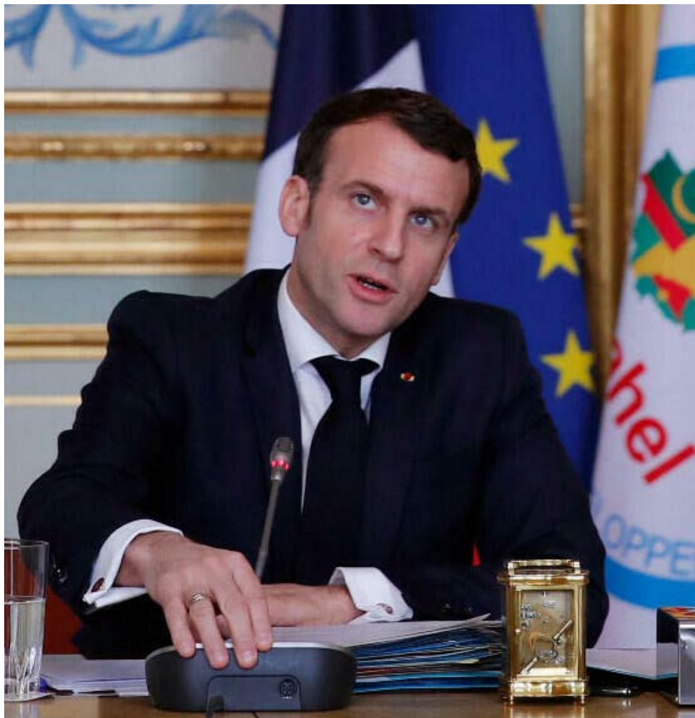
El presidente francés Emmanuel Macron.

Uno de los atentados más mediáticos sucedió en octubre de 2017, cuando el grupo de Abu Walid atacó una patrulla conjunta de Estados Unidos y Nigeria en la región nigerina de Tongo Tongo. Esta operación provocó la muerte de cuatro soldados estadouniden-