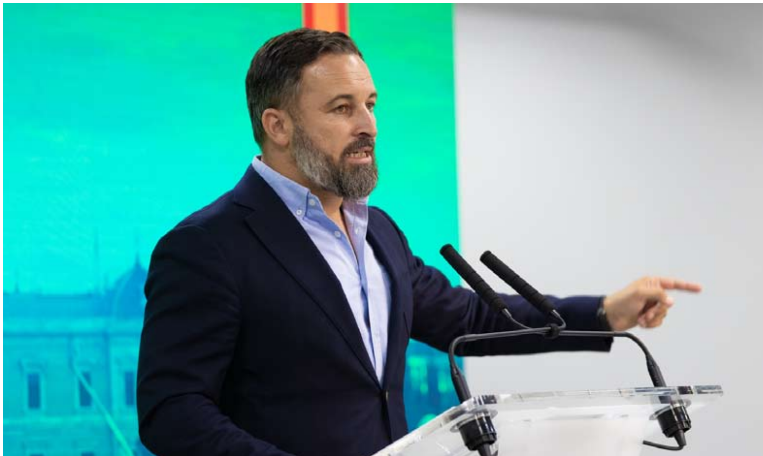
Santiago Abascal se ha convertido en el aliado estratégico del PP para formar un futuro gobierno.

to a Casado a hacerle guiños a Abascal y a Vox. Está remando en la dirección contraria de lo que hizo en 1990 a partir del Congreso de Sevilla. Entonces se trataba de llevar al partido al centro, ahora se trata de llevarle hacia la derecha confiando en que el centro se quedará por la falta de alternativas.