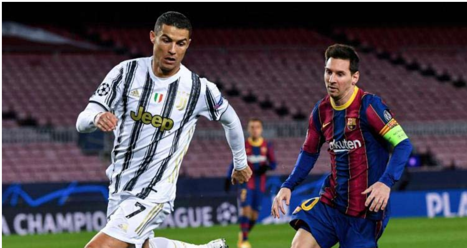
Cristiano Roaldo y Messi en un partido jugado cuando el luso estaba en la Juventus y el argentino en el Barça.