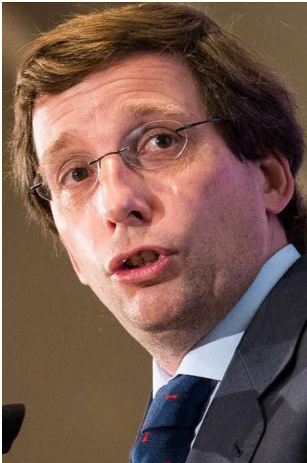
El alcalde de Madrid, José Luis Martínez Almeida.

Si José María fue duro con el líder del PSOE y del gobierno socialista, Pablo no quiere serlo menos. Y acusación por acusación ha ido un paso más allá desde la tribuna del Congreso y le ha dicho a Pedro Sánchez que es responsable de todos los