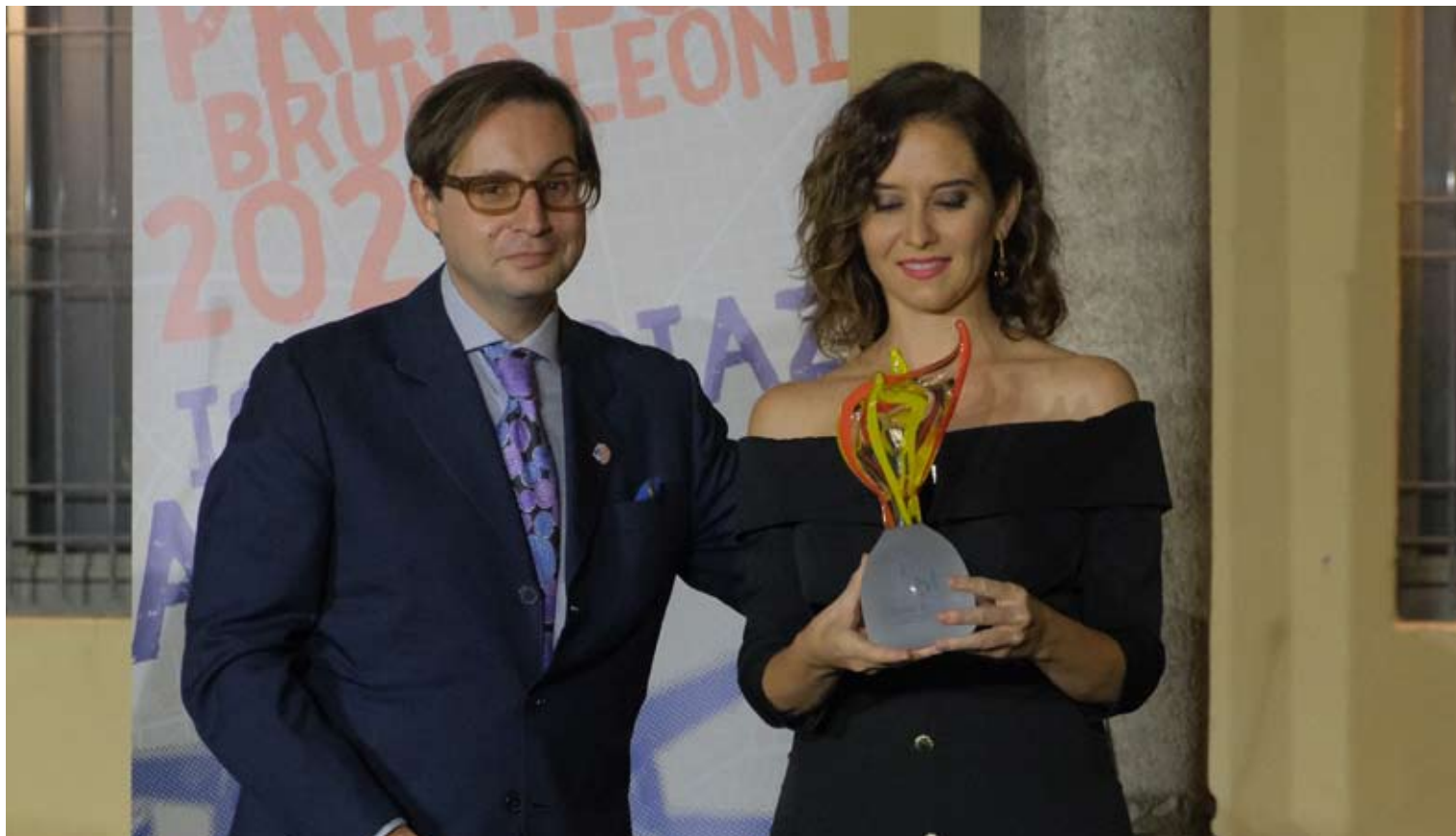
Isabel Dáz Ayuso recibiendo la Llama de la Libertad, que le ha otorgado el Instituto italiano Bruno Leon, en Milán.