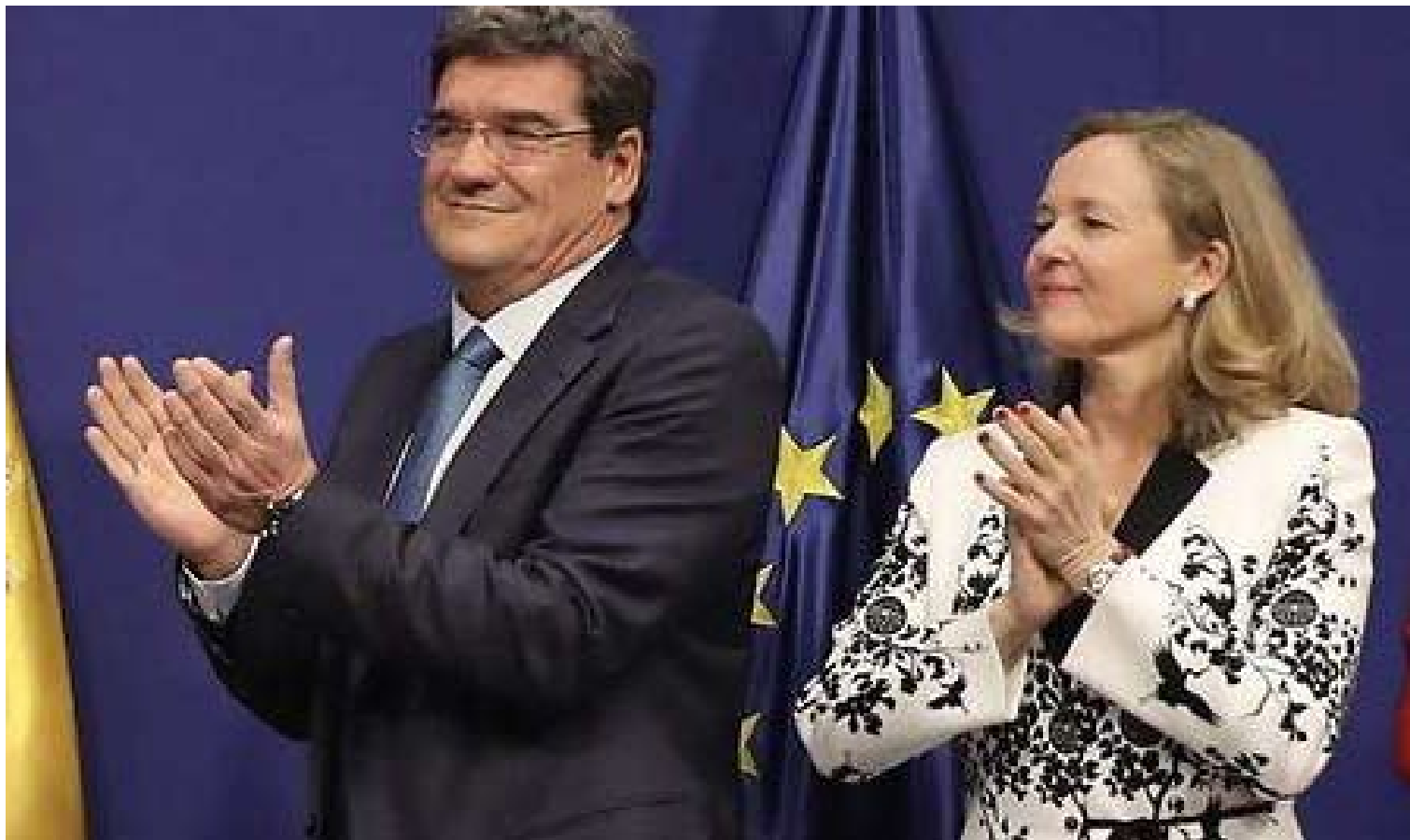
La ministra de Economía, Nadia Calviño, y el de Seguridad Social, José Luis Escrivá.

Frente a la decisión de Pablo Iglesias de dejar el Gobierno y la política, Yolanda Díaz mantiene la tesis de mantener como sea los pactos con Pedro Sánchez , aunque sea a cambio de flexibilizar sus pretensiones, cosa que el presidente del Gobierno agradece.