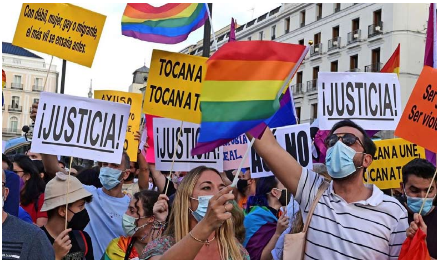
Manifestación del colectivo LGTBI en Madrid.