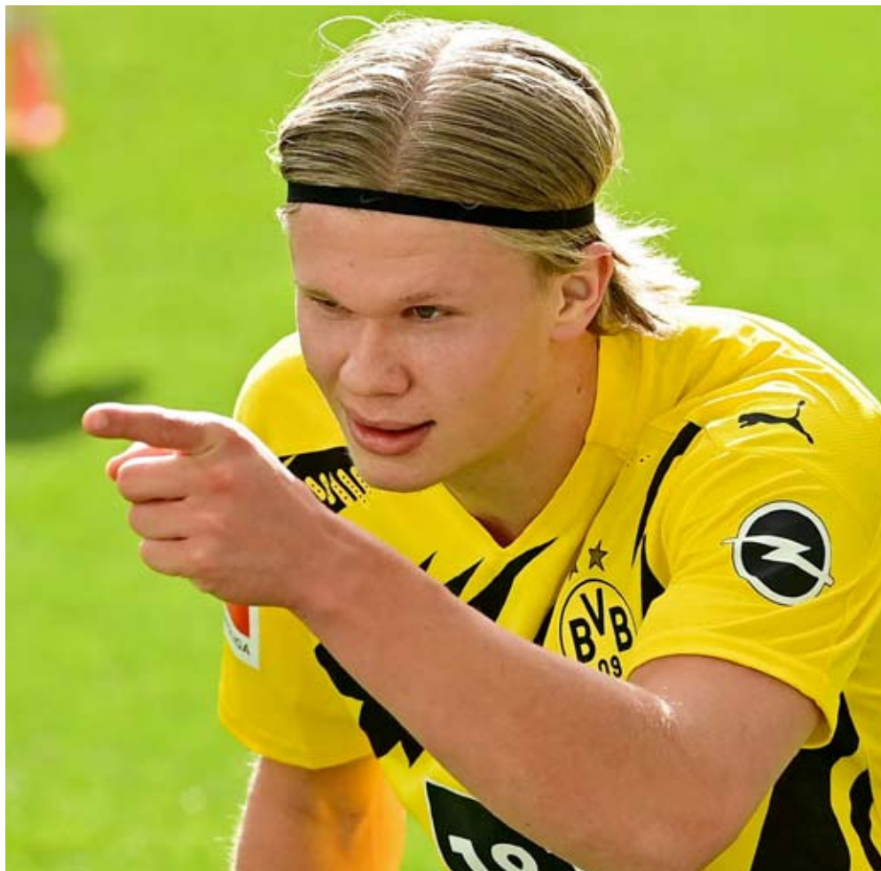
El noruego Haaland si marcó en su primer partido de la Champions ante el turco Besiktas.

Si jugaron juntas las tres estrellas en el primer partido de la Champions ante el Brujas, pero ninguno de los tres consiguió anotar y además Mbappe se