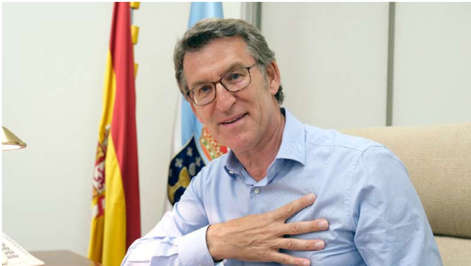
El presidente gallego Alberto Núñez Feijóo no se va a definir.

líder nacional del PP. Mientras tanto aprovecha un premio en Italia o se reúne con comisarios europeos para darse a conocer internacionalmente. Todo ello junto a baños de masas en Universidades privadas donde el alumnado es predominantemente de derechas para demostrar su popularidad y decir que “somos así, tenemos un ganador pero no lo usamos”, sin dar su nombre directamente.