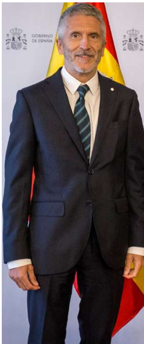
Fernando Grande Marlaska.

Sé que es duro pedirle la dimisión, o cesar, a quien te ha servido lealmente, incluso en los trabajos no tan limpios. Sobre todo, cuando Marlaska tendría ahora un difícil encaje en la Audiencia de la que salió. Pero no creo que Pedro Sánchez haga muchos remilgos al respecto, ni que mantenga mucho mas tiempo a Marlaska. Sabe que ya no es solución, sino problema. Y gordo, además.