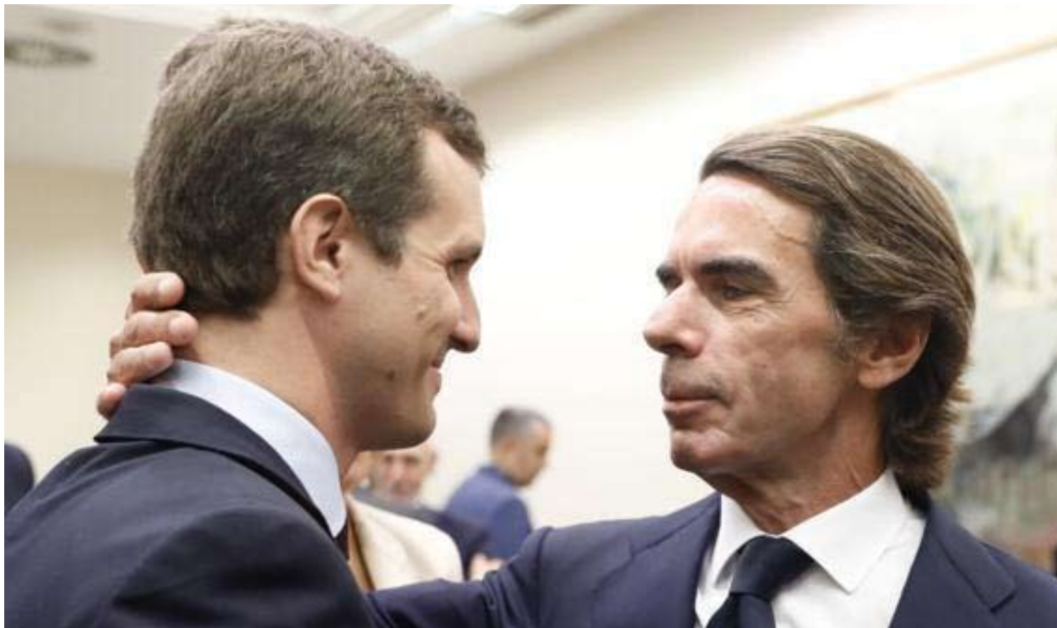
Pablo Casado recibe el visto bueno de José María Aznar.