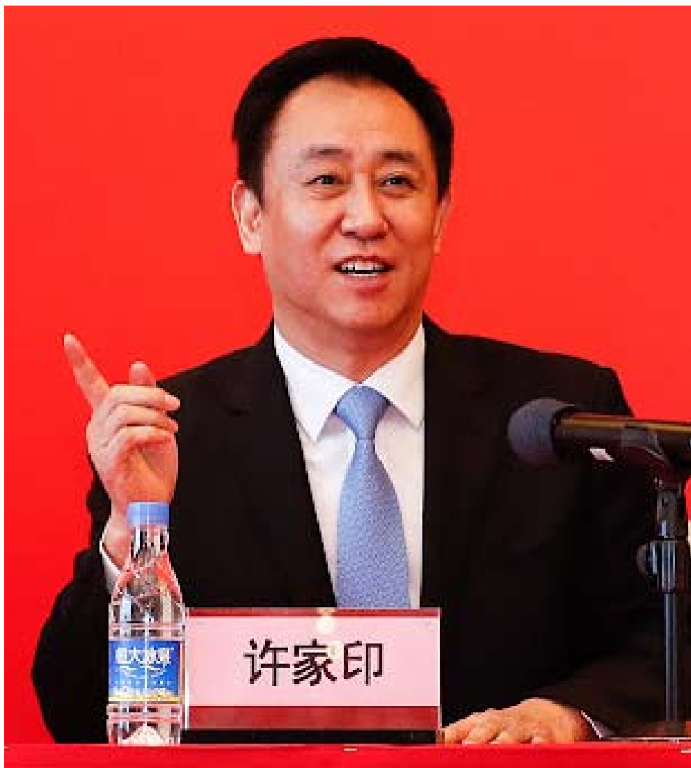
Xu Jiayin, presidente de la inmobiliaria china Evergrande.

Con todo, nadie duda de que, si es preciso, se implementarán nuevas medidas extraordinarias, y de hecho es lo previsible a partir de entonces, porque ningún banco central desea errar en retirar precipitadamente estímulos, no vaya a ocurrir que a la inflación se sume la contracción de las economías y hayamos